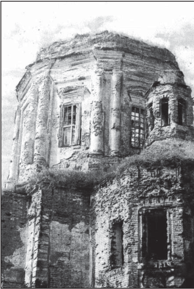
Залишки Покровської церкви у Дігтярівці. Фото поч. ХХІ ст.

Про кількість убитих і поранених з обох сторін є суперечливі дані – від кількох сотень до 3 тисяч. Наші 45-річні пошуки дають підстави скептично сприймати наступну тезу: «Шведи під прикриттям артилерії навели мости для переправи». З цим можна і погоджуватись, і сперечатись. Дослідження поховань шведів в яру Шведівщина у Свердловці та ін. говорять про те, що у Мізині Карл і Мазепа зайняту росіянами багатокілометрову, заболочену, усіяну водоймами заплаву форсувати наміру не мали. Вони прагнули заманити сюди в «мішок» росіян, а форсувати Десну і заплаву нижче Свердловки в яру Шведівщина. Коли це відбулося на лінії «Шведівщина – Дзвінке», Петро I, зрозумівши все, почервонів від гніву. Вирішення цієї стратегічної задачі відкрило шведам шлях до Батурина, але вже було пізно: їх випередив Меншиков. Перші підступи до шляху в Батурин почалися з Курилівського Накоту. Він «народився як воїн», але історична роль його цим не обмежилася: він проявить себе і як «мирянин».