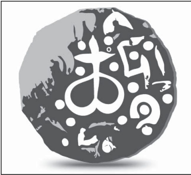
Мал.1. Новгород-Сіверська монета з якоревидною тамгою