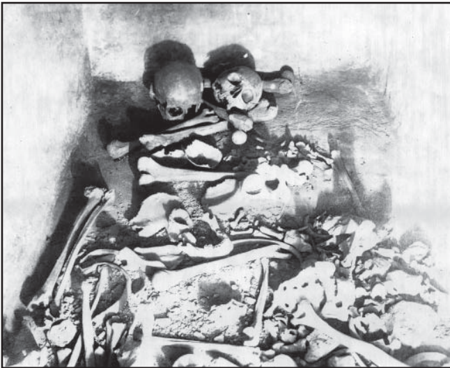
Останки похованих у саркофазі, виявлені в 1936 р.