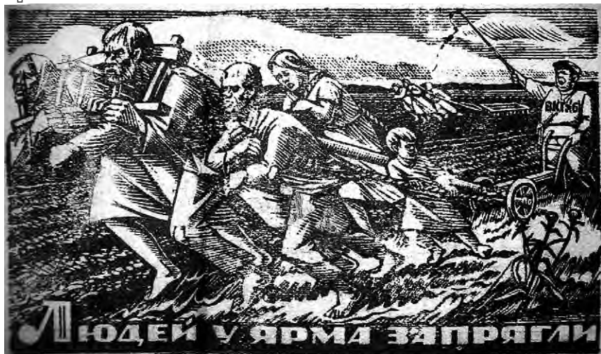
Дереворит ОУН, вилучений органами МГБ в Камінь-Каширському р-ні у 1949 р.