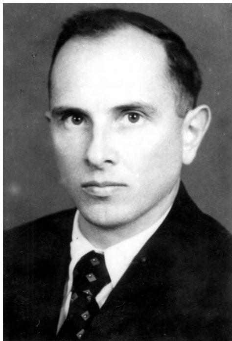
Степан Бандера, 1946 р.

Особі цього діяча присвячено багато праць, але зробити належний аналіз його діяльності та визначити його місце в історії українська історична наука ще не спромоглася. Сучасним дослідникам належить дати ґрунтовну оцінку Степанові Бандері як людині, теоретикові й інтерпретатору націоналістичної ідеології, організаторові й лідеру ОУН 1930—1950 рр. В історіографії перебування С. Бандери в ув'язненні є зовсім недослідженими та оповиті різними міфами, особливо в концтаборі Заксенгаузен в 1942—1944 рр.