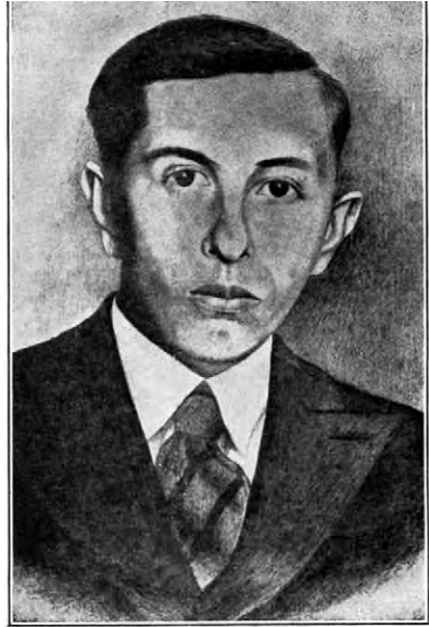
“Згинути, а не зрадити!” “Нас розсудить залізо й кров!” (СТЕПАН БАНДЕРА, член ОУН, засуджений на досмертню тюрму в варшавському процесі)

всю пивницю, але було видно, що вікон не було. Був тільки отвір у стіні дуже високо, заґратований грубими залізними ґратами, який виходив на той коридор, звідки я прийшов. Між тим отвором і дверима була округла висока піч, що могла б зовсім добре бути прототипом теперішньої космічної ракети. Отвору не мала. Потім показалося, що в ній палиться з коридору. Обійшовши піч, побачив я характеристичний для тюрми на “Святім Хресті” кібель (парашу). Це був великий, проміром на дві треті метра, валець, високий на три чверті метра. Тому що був з грубого металу, був сильний і тяжкий. Зверху мав менший отвір зі щільною накривкою, який був у більшій на цілий промір накривці, що відкривав-