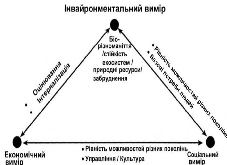
Рис. 1. Три виміри в концептуальних рамках сучасної парадигми сталого розвитку

Саме на міждисциплінарному підході робився наголос одним із авторів цієї статті, визначаючи, що з формальної точки зору сталий розвиток має розглядатися як гармонізація співвідношень трьох підсистем системи цивілізації – соціуму, економіки і довкілля, а відповідне ілюстративне подання пояснювало домінантне положення соціального виміру [13, С. 101] на відміну від рис. 1, де його місце займає інвайронментальний вимір.