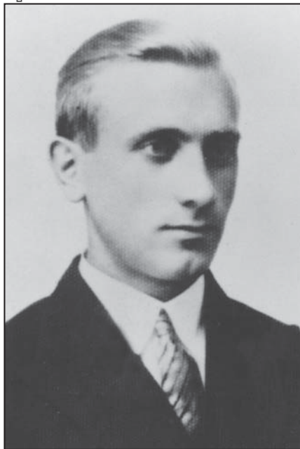
Дмитро Клячківський. Фото 1930-х рр.

ла 5500 осіб VII . Це дозволило розпочати підготовку антирадянського повстання, яке планувалося на вересень 1940 р. Для цього було розроблено «Мобілізаційний план», що був розісланий у всі області Західної України у серпні 1940 р. Попередньо зроблено облік військових-українців РККА VIII . Розвідка ОУН (керівник — М. Матвійчук) проводила збір матеріалів про розташування та плани військових частин РККА. Також створювали «чорні списки» працівників партійних структур, офіцерів РККА, співробітників НКВД, осіб, що прибули зі Сходу України. Було проведено заходи для створення т. зв. «Сеньйорату» — авторитетних осіб, що повинні стати «кістяком» державного апарату новоствореної держави внаслідок повстання. Ця робота у Львові була доручена М. Пакулякові.