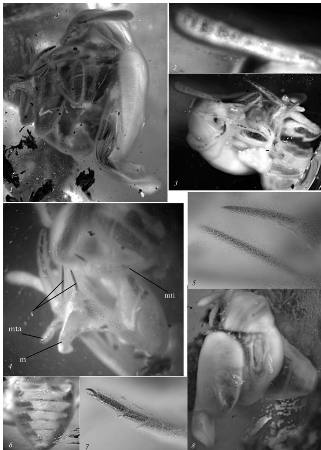
Рис. 2. Prionochaeta gratschevi sp. n., голотип (инв. номер К-2993 коллекции Института зоологии НАН Украины, Киев): 1 — общий вид сбоку; 2 — антенна; 3 — общий вид снизу; 4 — ноги и метэндостернит: s — шпоры задних голеней, mta — средняя лапка, mti — средняя голень, m — метэндостернит; 5 — шпоры задних голеней; 6 — брюшко; 7 — задняя лапка; 8 — общий вид сверху.