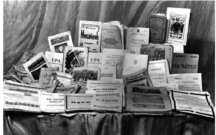
Підпільна література, конфіскована НКВД в будинку в с. Білогорця 5 березня 1950 р.

літератури слід надіслати. Також вони були зобов'язані наглядати за транспортуванням літератури, забезпечувати зв'язкові лінії відповідними криївками для її зберігання, карати за невинуватого затримку вантажу. Постійної прив'язки до терену чи певних організаційних осередків не було — літературу скеровували туди, де її найбільше бракувало. Щоб запобігти втратам під час транспортування, керівники осередків пропаганди у звітах мали зазначати: коли, скільки і яку літературу одержано; хто і як перевіряв, чи дійшла вона до найнижчих організаційних осередків; скільки розкинено літератури в обласних центрах, по районах, селах 51 . Володіючи такою інформацією, керівники пропаганди могли оперативно реагувати на брак пропагандивних видань у тому чи тому районі. Поширенням літератури займалась не лише мережа ОУН, а й бійці УПА, з приводу цього вони були спеціально інструктовані 52 . Деякі акції бойових відділів мали на меті винятково поширення агітаційної літератури.