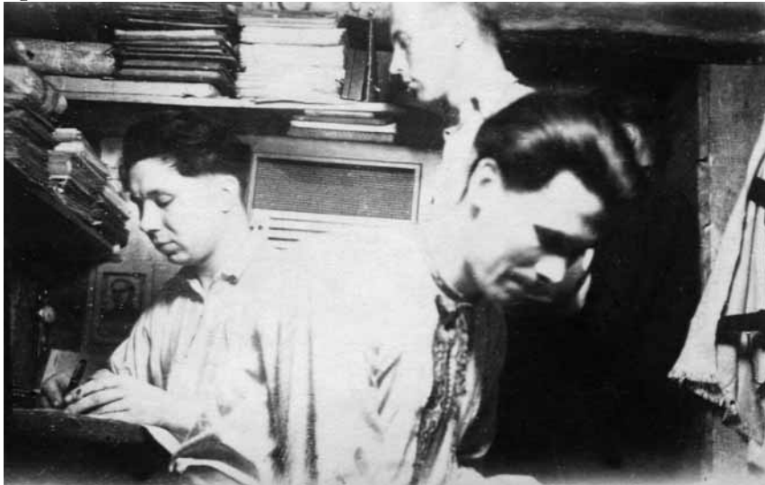
Підпільники за роботою над пропагандивними матеріалами в підземному бункері

ідейно-політичні аспекти програми, давали настанови щодо висвітлення подій та ідеологічних явищ, робили зауваження з приводу невідповідного використання деяких політичних термінів. Зокрема, в інструкції від 28 січня 1946 р. 'Петро Полтава' наказував публіцистам звернути увагу на реакційну сутність Організації Об'єднаних Націй, яка представляла інтереси імперських держав, не рекламувати Нюрнберзький процес як «тріумф міжнародної справедливості» (бо хто і кого судить?), бути обережними в оцінці антібільшовицьких рухів у країнах, окупованих СРСР, зокрема не називати польську АК силою політично аналогічною УПА («в нас є спільний ворог і більше, властиво, нічого») 28 . Одночасно керівник ГОСП застерігав від необачних і провокаційних висловлювань на адресу російського та інших народів, а також радив не перебільшувати власних досягнень, а саме: не писати про Фронт поневолених народів як про доконаний факт, оскільки на даному