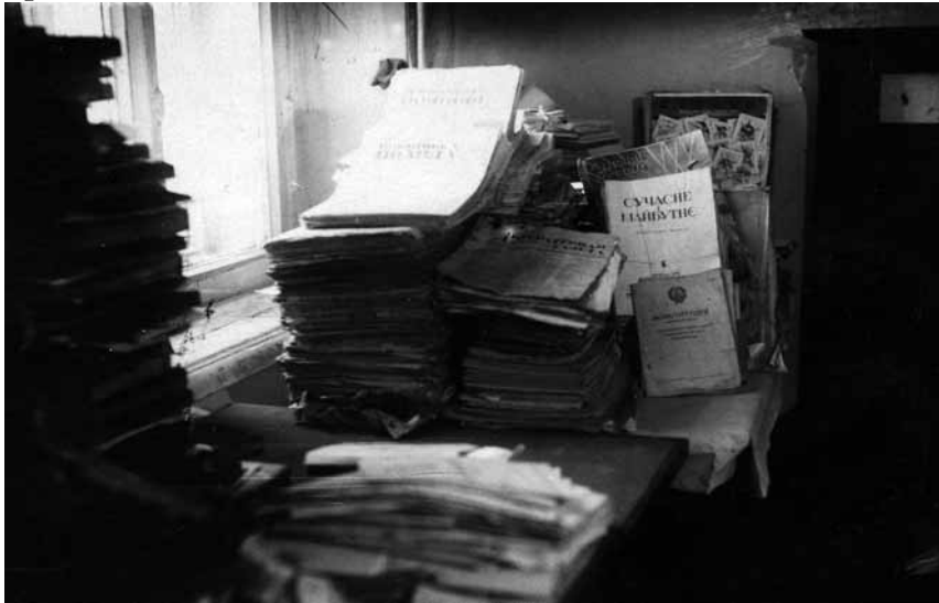
Підпільні видання ОУН, конфісковані НКВД (Хмельниччина, початок 1950-х рр.)

літератури слід надіслати. Також вони були зобов'язані наглядати за транспортуванням літератури, забезпечувати зв'язкові лінії відповідними криївками для її зберігання, карати за невинуватого затримку вантажу. Постійної прив'язки до терену чи певних організаційних осередків не було — літературу скеровували туди, де її найбільше бракувало. Щоб запобігти втратам під час транспортування, керівники осередків пропаганди у звітах мали зазначати: коли, скільки і яку літературу одержано; хто і як перевіряв, чи дійшла вона до найнижчих організаційних осередків; скільки розкинено літератури в обласних центрах, по районах, селах 51 . Володіючи такою інформацією, керівники пропаганди могли оперативно реагувати на брак пропагандивних видань у тому чи тому районі. Поширенням літератури займалась не лише мережа ОУН, а й бійці УПА, з приводу цього вони були спеціально інструктовані 52 . Деякі акції бойових відділів мали на меті винятково поширення агітаційної літератури.