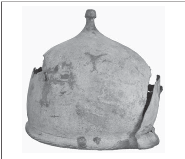
Рис. 2. Шолом типу Монтефортіно А/В (Білгород-Дністровський краєзнавчий музей)

му Причорномор'ї, тому жодних археологічних підстав для гіпотези про малоазійське (галатське) походження цих речей, а також їхніх господарів-сарматів, учасників малоазійських походів Мітрідата VI Евпатора, немає (Зайцев 2008, с. 7, 11). Сама гіпотеза була названа не інакше як «казусом вітчизняної сарматології» (Зайцев 2007).