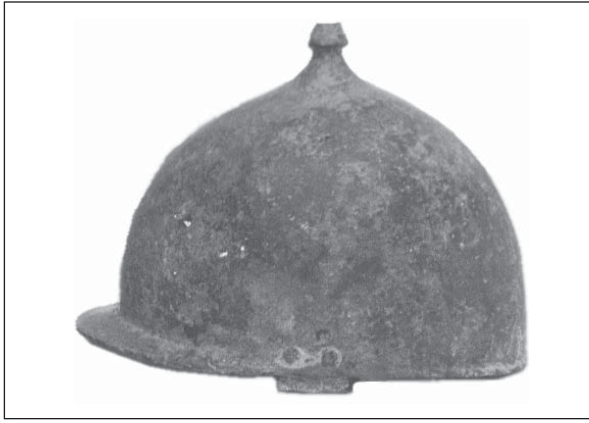
Рис. 1. Шолом з Тілкїлі Каї поблизу Богазкеї (Bittel 1985)