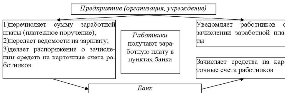
Рис 2. Механизм получения заработной платы при зарплатном проекте

В бухгалтерском учете операции по погашению задолженности предприятия по заработной плате перед своими работниками представлены следующим образом (рис.2):