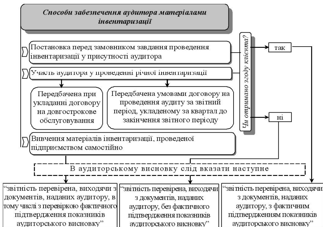
Рис. 2. Можливі способи забезпечення аудитора матеріалами інвентаризації.

Однак у вітчизняній практиці аудиту, отримання інформації про фактичні залишки матеріальних цінностей та результати звірки стану зобов'язань досить ускладнене. Нормативно-правові акти не визначають право аудитора отримувати таку інформацію від підприємства. Основні способи забезпечення аудитора матеріалами інвентаризації залежать від умов співпраці аудиторської фірми та підприємства, що підлягає аудиту, а порядок їх розкриття в аудиторському висновку враховує ступінь доступу аудитора до необхідної інформації (рис.2):