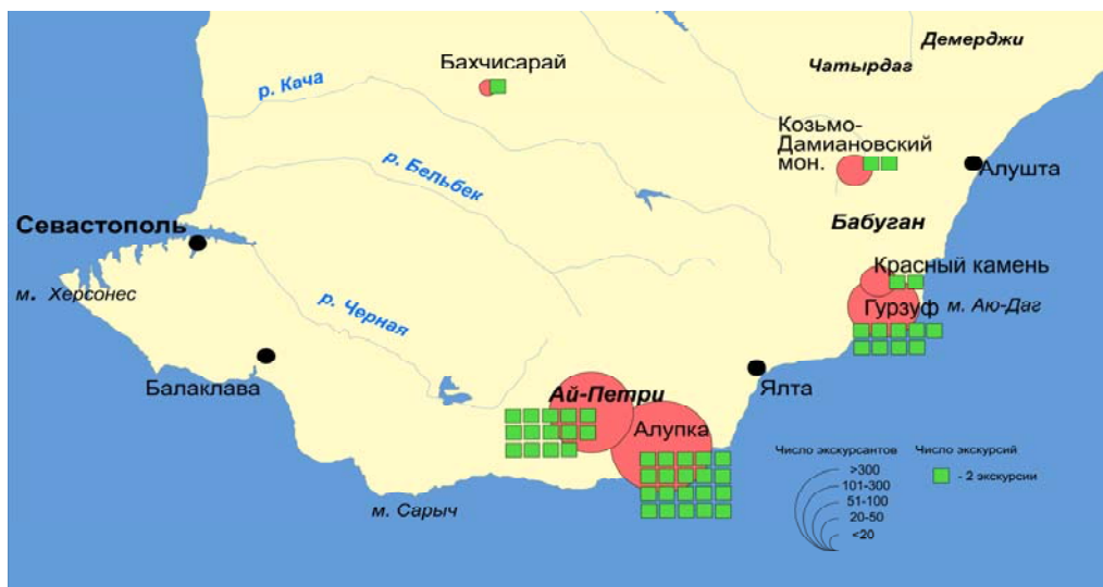
Рис. 3. Экипажные экскурсии Ялтинского отделения Крымского горного клуба, в 1917 г.