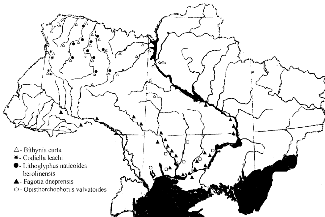
Рис. 1. Пункты местонахождения 5 видов моллюсков Правобережной Украины.