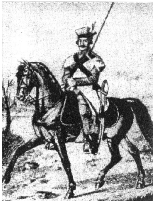
Рядовий пікінер Дніпровського пікінерного полку