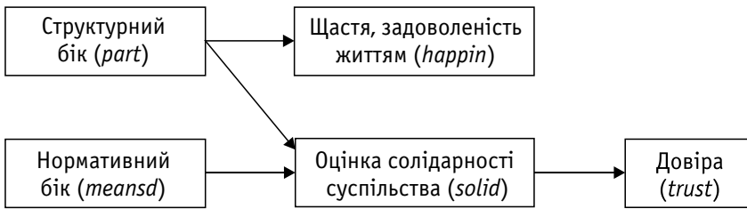
Рис. 2. Шляхова діаграма

норідність думок є чинниками впливу на оцінку людьми стану солідарності у суспільстві на підставі власної позиції у ньому: чим більше люди включені у різні сфери життя і чим більше вони поділяють погляди спільноти, тим вище вони схильні оцінювати рівень солідарності у ній. Виходячи з розглядуваної тут теорії, два виміри соціальної солідарності є незалежними один від одного, тому передбачається, що кореляційний зв'язок між змінними, які відповідають цим концептам, буде відсутній (пригадаймо двовимірний простір). Раніше вже згадувалося про взаємозв'язок між концептами довіри й соціальної солідарності. Ці два явища тісно переплетені у реальному житті: з одного боку, довіра є підґрунтям для розвитку співпраці, певних солідарних дій, але, з іншого боку, вона виникає саме на основі вже наявного позитивного досвіду взаємодій, тобто вона вже є результатом солідарних дій. Відштовхуючись від наявних емпіричних даних, можна перевірити, наскільки наявна оцінка солідарності українського суспільства впливає на рівень довіри у цьому суспільстві. Таким чином, сформулювавши гіпотези про взаємозв'язки між основними концептами теорії, можна перейти до етапу перевірки моделі. Усі ці компоненти зображені у шляховій діаграмі (див. рис. 2).