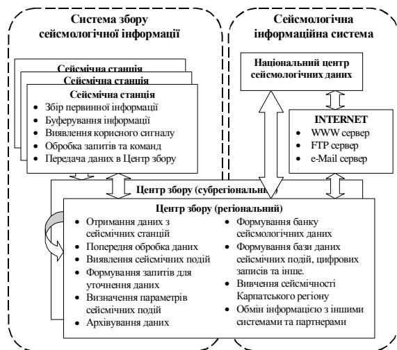
Рис. 2. Функціональна схема інформаційних потоків КРСМ

На базі сейсмостанції “Львів” організовано Регіональний сейсмологічний центр (РСЦ). Тут відбувається управління потоками інформації у всіх ланках системи, а також документування і збереження всієї інформації, яка надходить. РСЦ забезпечується програмними засобами для обробки, систематизації та архівування одержаної сейсмологічної інформації. Функціональна схема інформаційних потоків КРСМ представлена на рис.2 [Вербицький С.Т. та ін., 2004].