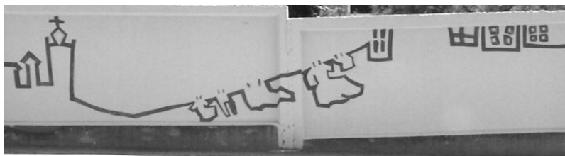
Илл. 7. Фрагмент росписи стены на обводной дороге в Ялте.

Рассматривая культурный ландшафт как текст, в данном случае мы можем считать данный объект текстом в тексте. Изображения крымских достопримечательностей здесь будут одновременно и знаками, словами, которые составляют текст всей росписи, они же будут и самостоятельными текстами, каждый из которых рассказывает свою историю. В этом реализуются функции текста в общей системе культуры – «адекватная передача значений и порождение новых смыслов» [10].