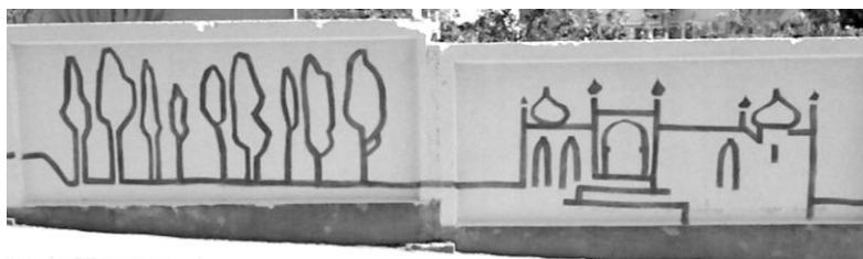
Илл. 6. Фрагмент росписи стены на обводной дороге в Ялте.

Эта линия состоит из отрезков и «точек», которыми стали узнаваемые достопримечательности Крыма, рассказывающие о разных этапах в истории, периодах местной культуры. Среди них – Никитский ботанический сад, Воронцовский (илл. 5, 6), Массандровский, Ливадийский дворцы, Ласточкино гнездо и многие другие элементы культурных ландшафтов ЮБК.