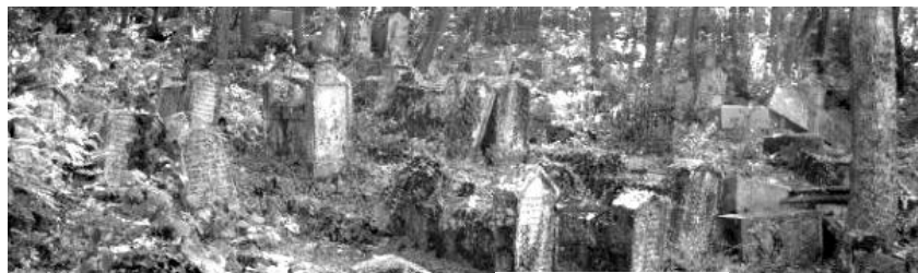
Илл. 3. Караимское кладбище Балта Тиймез вблизи Бахчисарая.

можно рассматривать и как тексты культуры, и как знаки-слова, формирующие текст культурного ландшафта.