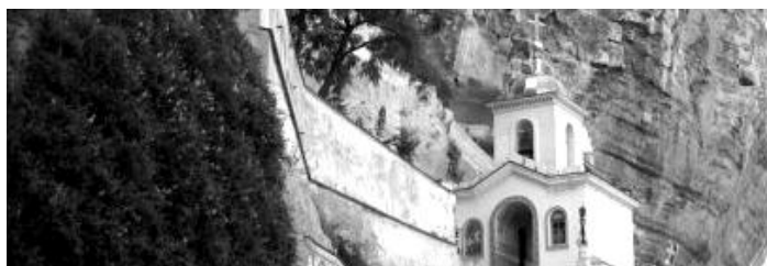
Илл. 2. Звонница Свято-Успенского монастыря вблизи Бахчисарая.

Линия центральной улицы Старого города, которая повторяет линию реки, идёт через несколько важных объектов, составляющих культурный ландшафт Бахчисарая. Следуя этой линии, мы встретим памятники великому русскому поэту А. Пушкину и крымско-татарскому просветителю И. Гаспринскому, Ханский дворец (илл. 1), дом-музей И. Гаспринского, расположенные вблизи города Свято-Успенский мужской монастырь (илл. 2), караимское кладбище Балта Тиймез (илл. 3) и средневековую крепость Чуфут-Кале.