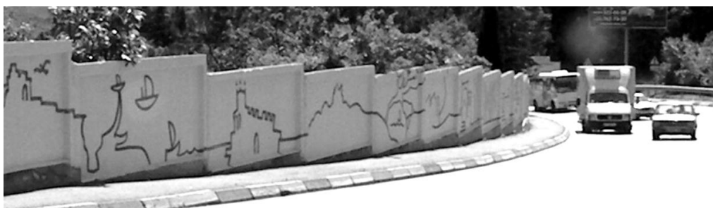
Илл. 8. Фрагмент стены на обводной дороге в Ялте.

Рассматривая культурный ландшафт как текст, в данном случае мы можем считать данный объект текстом в тексте. Изображения крымских достопримечательностей здесь будут одновременно и знаками, словами, которые составляют текст всей росписи, они же будут и самостоятельными текстами, каждый из которых рассказывает свою историю. В этом реализуются функции текста в общей системе культуры – «адекватная передача значений и порождение новых смыслов» [10].