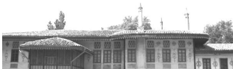
Илл. 1. Жилые покои Ханского дворца в Бахчисарае.

Примером такого культурного ландшафта является историческая часть Бахчисарая – Старый город, расположенный в предгорьях, на склоне Внутренней гряды Крымских гор, в долине реки Чурук-Су, для которого характерна сохранившаяся со средних веков традиционная планировка (узкие кривые улицы) и крымскотатарские дома.