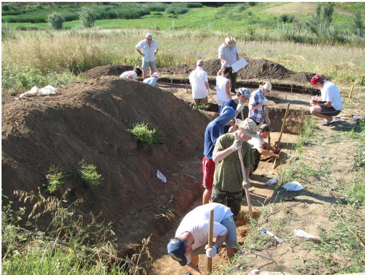
Фото 11. Розкопки стоянки Троянове 4. 2009 р.