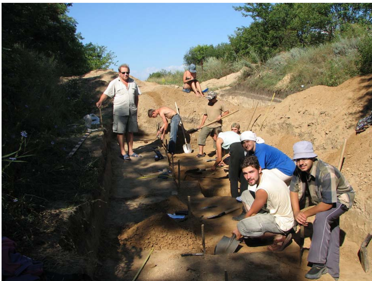
Фото 12. Розкопки стоянки Вись. 2009 р.