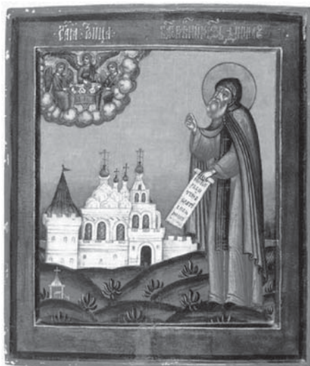
Св. кн. Даниил Московский в молении Св. Троице, с видом Данилова монастыря. Икона. Конец XVII – начало XVIII в. Государственный музей истории религии (Санкт-Петербург, Россия)

запустел и был возобновлен только в 1560 г. по воле Ивана Грозного 13 .