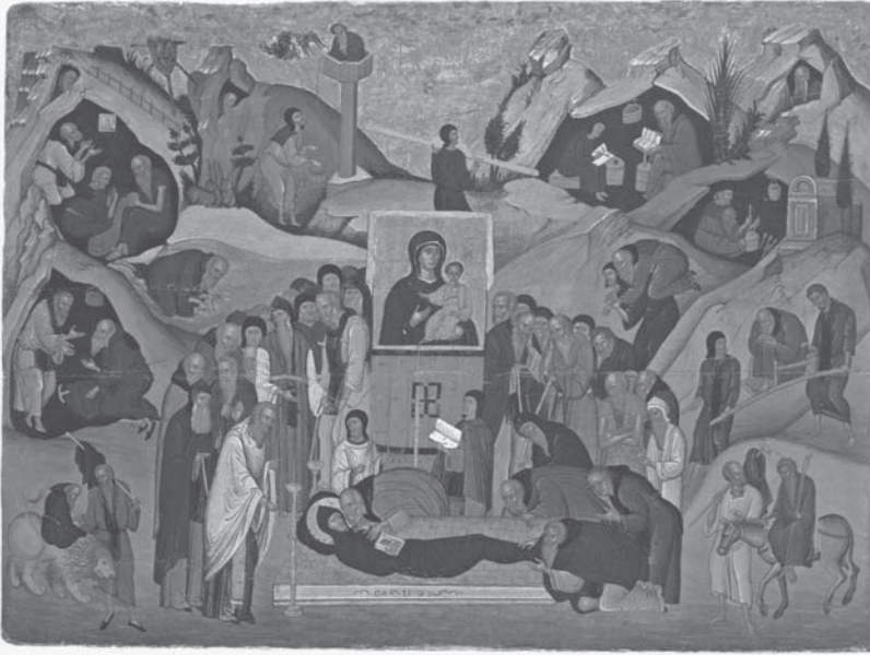
Успение Св. Ефрема Сирина. Византийская икона. Середина XV в. Музей византийской культуры (Афины, Греция)

В сирийском Житии Св. Ефрема, памятнике VI – VII вв., также переведенном на церковнославянский язык и вошедшем в состав Паренесиса, описывается, как в момент погребения святого прощание с ним происходило в присутствии клира, народа, монахов и столпников 74 . Последние лишь в самых исключительных случаях сходили со своих столпов, прерывая данный Богу обет служения. Описанный в житии факт красноречиво свидетельствует об особом почитании древними столпниками Св. Ефрема, сложившемся если не при его жизни, то уже на ранних этапах прославления святого.