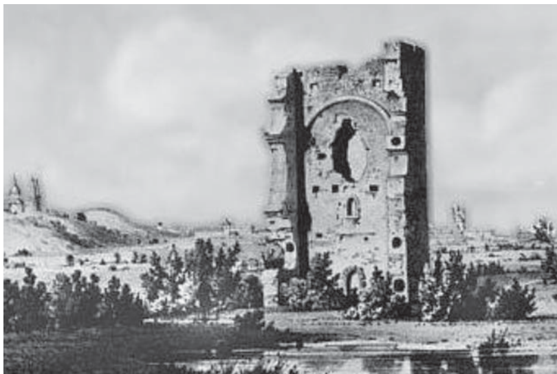
Адам Ле Руе (1825? – 1863). Развалины башни в Белавине. Рисунок из “Люблинского альбома” (1857 – 1860 гг.)

высоте ок. 18 м и толщине стен ок. 1,7 м. О возможном культовом предназначении сооружения свидетельствуют размеры и форма окон, устроенных в его верхнем ярусе. Эти окна значительно превышали размеры бойниц и представляли собой широкие (до 1,7 м) проемы с полуциркульным завершением, отделанные белым и зеленым тесаным камнем. На внутренней поверхности стен на уровне верхнего яруса были зафиксированы следы штукатурки и красочной росписи. Над увенчанным сводом верхним ярусом башни, вероятно, был устроен еще один ярус, представлявший собой открытую площадку 47 .