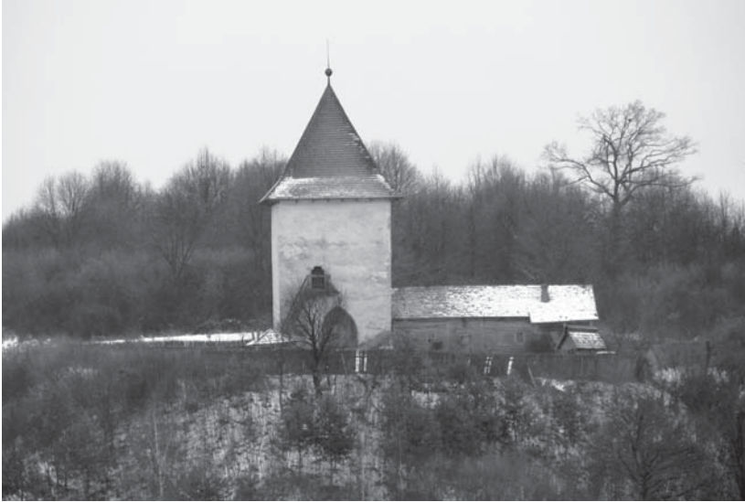
Пятничанская башня. Конец XIII – первая половина XIV в.

Современный вид (с. Пятничаны Жидачевского района Львовской области)