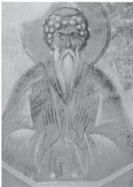
Феофан Грек (ок. 1340 – ок. 1410) Даниил Столпник. Фреска церкви Спаса на Ильине улице. 1378 г. (Великий Новгород, Россия)

Вопреки распространенному в литературе мнению, что в средневековой Руси младенца нарекали по имени святого, память которого приходилась на день крещения новорожденного, совершаемого на сороковой день после рождения, Б. М. Клосс доказывает, что в княжеской среде действовало другое правило. На основе многочисленных летописных свидетельств за XIV – XV вв. исследователь устанавливает, что в княжеских семьях крестильное имя в большинстве случаев выбиралось по дню рождения и соответствовало имени