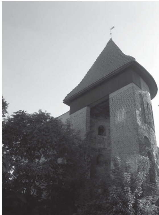
Готическая или Круглая башня. Предполагаемая башня-столп, построенная Даниилом Галицким в середине XIII в. Современный вид (г. Люблин, Польша)

Из приведенного летописного известия следует, что построенная Даниилом в Люблине башня имела не столько военно-оборонительное, сколько сакральное предназначение: башня, именуемая столпом, была жилищем монахов, вероятно, приверженцев особого рода монашеского служения – столпничества. И только в минуту большой опасности князь Конрад со своими приближенными получил убежище в этом столпе.