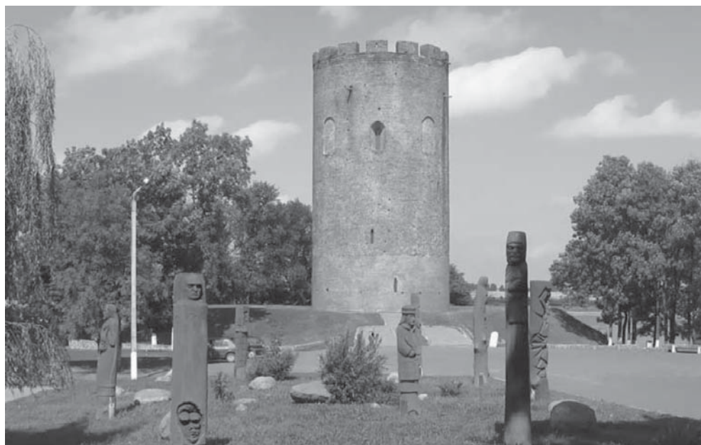
Башня-столп Владимира Васильковича. Вторая половина XIII в. Современный вид (г. Каменец Брестской области, Беларусь)