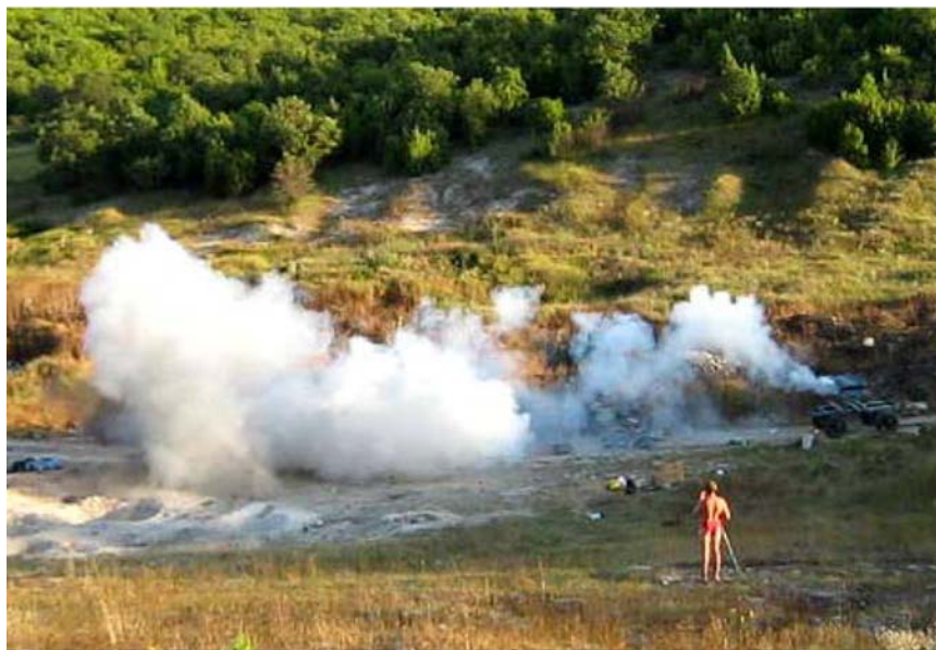
Рис. 2. Фрагмент залпового распыления биосорбентов из 5-ти стволов.

ствия суммарного вихря повышались в 1,5—2,5 раза по сравнению с арифметической суммой площадей воздействий этих отдельных элементов, составивших единый вихрь. Повышена дальность функционального воздействия до 53 м (в 4,5 раз более по сравнению с выстрелом-распылением из одного ствола) и величину площади равномерного распыления биосорбента до 450 м 2 при залпе из 5 стволов, расположенных в шахматном порядке. Это в 2,3 раза больше чем сумма отдельных площадей эффективного воздействия при последовательном распылении из 5-ти стволов. Для сравнения залповое воздействие боевых ракет или снарядов не увеличивает дальность их полёта, а только повышает площадь поражения до 1,5 раза, по сравнению с арифметической суммой площадей поражения такого же количества отдельных взрывов ракет и снарядов. Есть основания предположить, что эффективность работы импульсно-распылительного модуля и боеприпасов для него вполне сравнима по надёжности, стабильности и масштабам воздействия с современным вооружением.