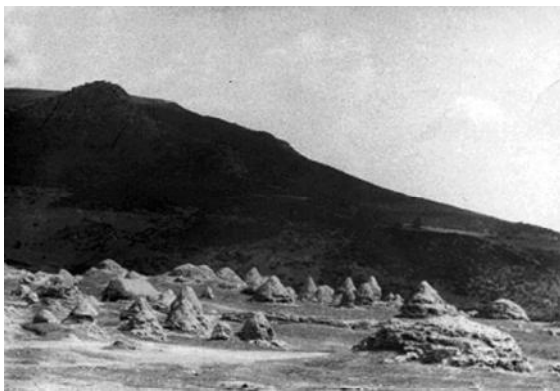
Рис. 1. Евапорити, що утворились від гейзерів на околиці м. Гюельма-Маскутін (фото О. О. Орлова [12])