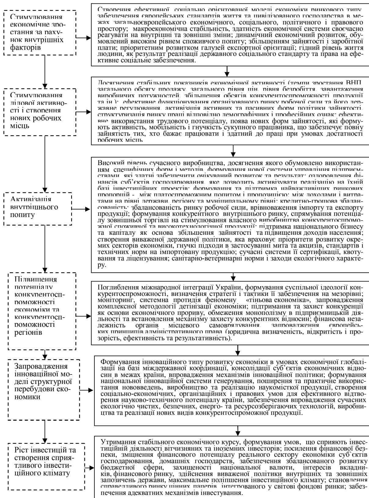
Рисунок 3 – Очікуванні результати реалізації національної стратегії сталого розвитку