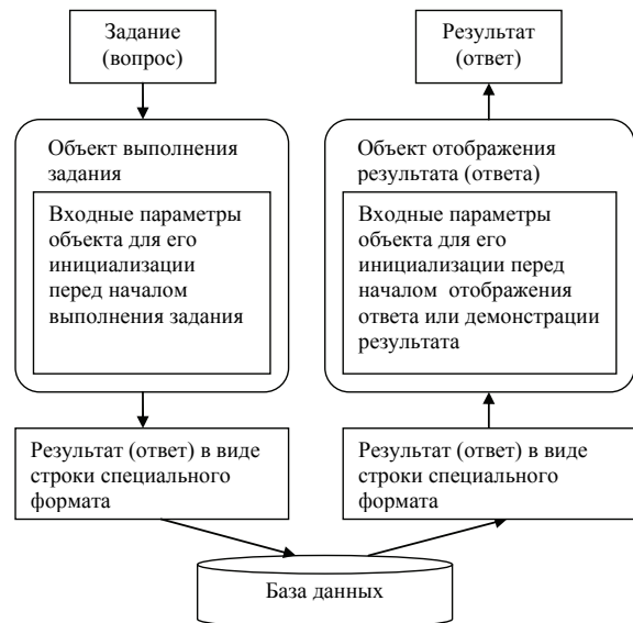
Рис. 2. Схема взаимодействия объектов и базы данных

Вследствие отсутствия отдельной спецификации стандарта IMS для лабораторных (адаптивных) тестов рассмотрим метод их моделирования, состоящий в следующем [6]. Разрабатываются два объектных модуля, связанных между собой интерфейсом передачи данных специального формата. Первый модуль (объект прохождения теста) предназначен для прохождения теста лабораторного (адаптивного) типа, а второй (объект отображения ответа) – для отражения результатов прохождения теста при проверке. Схема взаимодействия объектов модуля тестирования и базы данных приведена на рис. 2.