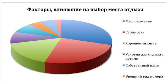
Рис. 3. Факторы, влияющие на выбор места отдыха.

Данные анализа исследования относительно общей оценки удовлетворенности отдыхом и лечением в крымских здравницах и гостиницах показали, что в сезоне 2011 года на отлично оценили отдых и лечение 82,68% респондентов. Хорошо провели отпуск 15,17% отдыхающих, а удовлетворительно и плохо менее 3%. Можно отметить некоторую положительную тенденцию этого года: на отлично и хорошо отдых в 2011 году оценили 97,85% респондентов, а в 2010 и 2009 годах - 94,56 % и 94,97% соответственно.