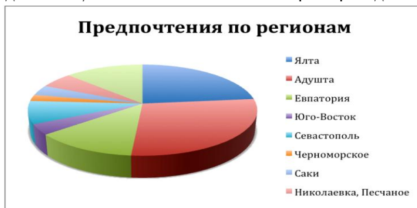
Рис. 5. Предпочтения туристов по регионам АР Крым.

В ходе проведения исследований туристам также был задан вопрос о том, какой регион они считают самым привлекательным для отдыха. Результаты ответов на этот вопрос приведены на рис.5