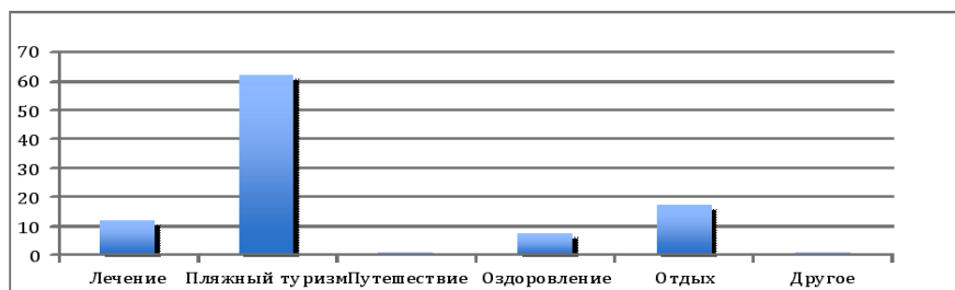
Рис. 1. Мотивация туристов, приезжающих в Крым.

Исследования показали, что 61.62 % рекреантов посетили АР Крым с целью пляжного туризма, 17,39 % назвали основной причиной приезда - отдых. В сравнении с прошлыми годами, количество отдыхающих, преследовавших целью отдых, значительно снизилось. Также наблюдается тенденция снижения показателя количества гостей, прибывающих с целью лечения. В 2011 году с целью лечения прибыло лишь 7,44 % гостей полуострова. Только 0,89 % от количества опрошенных приехало, чтобы ознакомиться с достопримечательностями Крыма и попутешествовать. По служебной необходимости в Крыму побывали 0,87 % гостей или по другим причинам. Этот показатель возрос в сравнении с прошлыми годами. Мотивация приезжающих в Крым приведена на рис. 1.