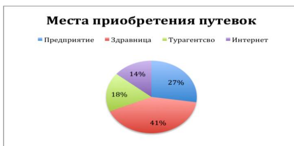
Рис. 2. Места приобретения путевок.