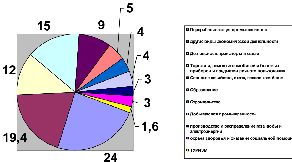
Структура ВВП Украины в 2009 (в процентах) Рис.1

В экономике Украины существует некое противоречие, туристическая отрасль в течение последних лет характеризуется положительной и постоянной динамикой роста количества туристов (Рис 2) и объемов предоставленных им услуг, однако доходы бюджета не увеличиваются в объеме эквивалентном развитию отрасли.