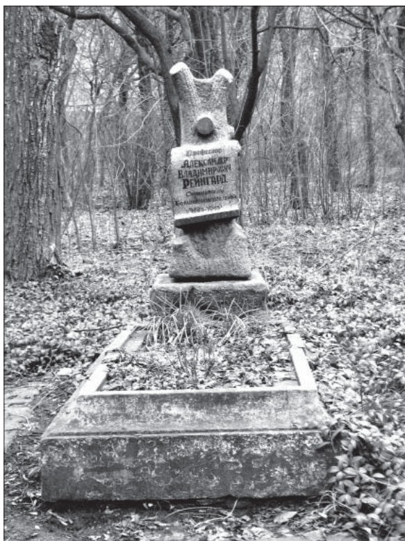
Могила О.В. Рейнгарда на території Ботанічного саду ДНУ імені Олеса Гончара.