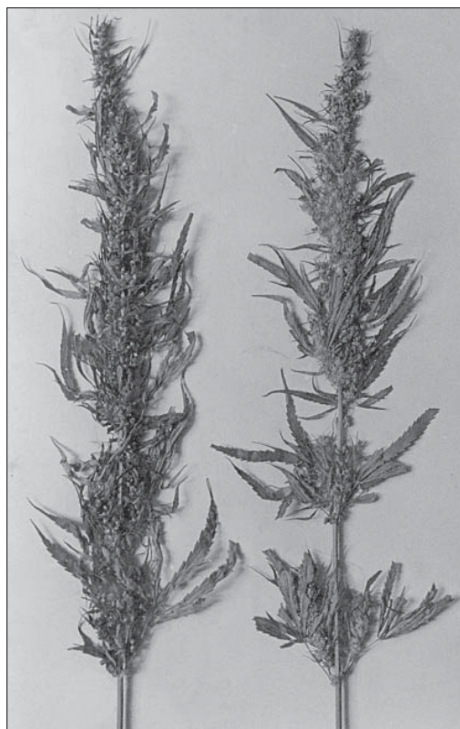
Одночасно вистигаюча конопля. Ліворуч — матірка, праворуч — плоскінь.

Микола Миколайович перший з академіків АН УРСР прибув до щойно звільненого Києва, щоб створити необхідні умови для повернення Академії наук України з