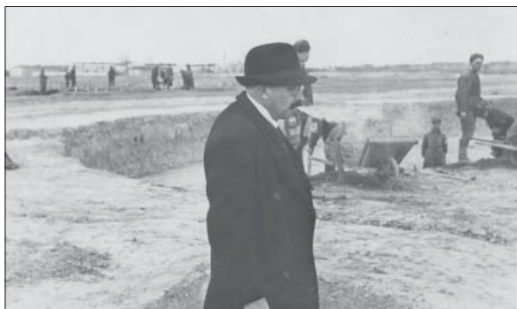
Тут буде розарій