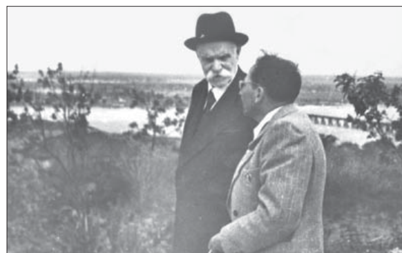
Є.О. Патон та М.М. Гришко