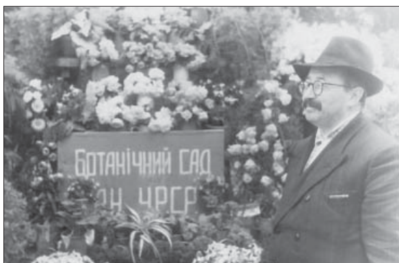
На міській виставці квітів