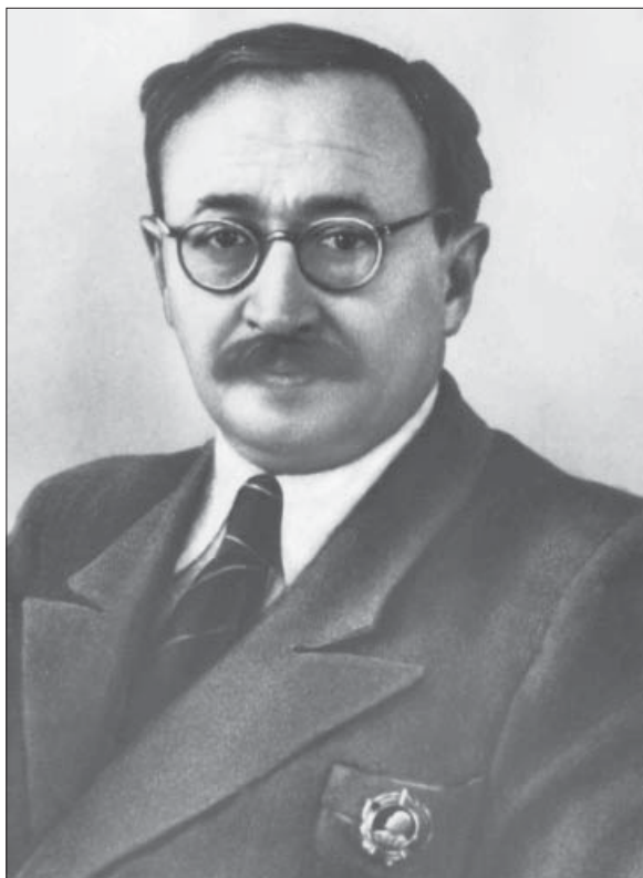
Микола Миколайович Гришко

Висвітлено життєвий та творчий шлях академіка Миколи Миколайовича Гришка. Показано його роль у створенні Національного ботанічного саду НАН України, який нині носить його ім'я.