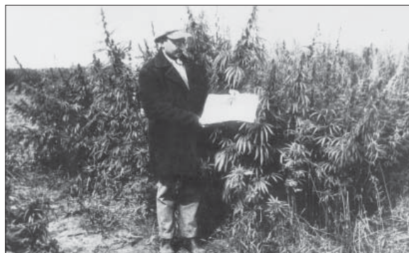
На конопляному полі

зований збір, рентабельність цієї культури при ручному зборі була надзвичайно низькою. На основі глибоких генетичних досліджень Микола Миколайович дав біологічну характеристику різним статевим типам конопель, розкривши генетичну природу статі і особливості її виявлення, розробив методику створення одночасно вистигаючих, а згодом і однодомних конопель [4, 5]. У 1935 р. він опублікував монографію "Генетика і селекція конопель", тобто йому належить пріоритет у вирішенні проблеми статі конопель. "Публикации Н.Н. Гришко 1930-х гг. являются пионерскими исследованиями, позволившими успешно реализовать в селекционной программе как генетическую, так и эпигенетическую изменчивость регуляции пола цветков у