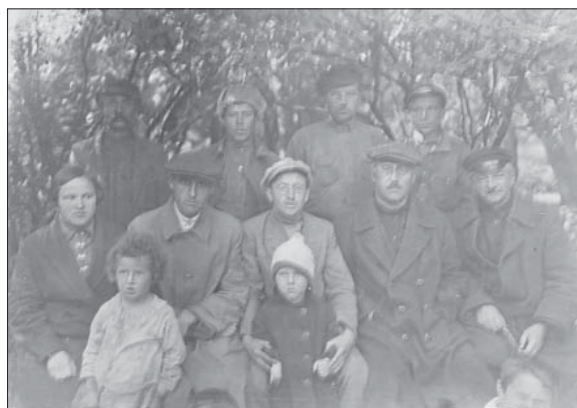
Серед викладачів Майнівського сільськогосподарського технікуму, 1926–1927 рр.