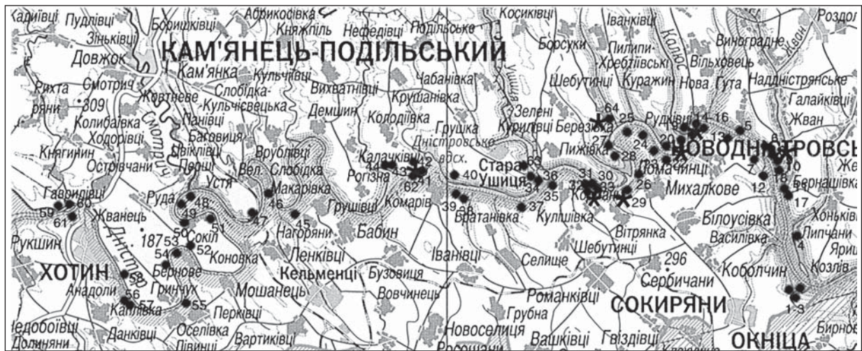
Рис. 1. Мапа пам'яток трипільської культури, виявлених Середньодністровською експедицією: I — поселення трипільської культури, II — поселення-майстерні; пам'ятки: 1—3 — Волошкове; 4 — Липчани; Березівський хутір: 5 — пох. 48, 6 — пох. 39; ГЕС, правий берег: 7 — пох. 15, 12 — пох. 13, 13 — пох. 16; ГЕС, лівий берег: 8 — пох. 12, 9 — пох. 11, 10 — пох. 10, 11 — пох. 9; 14 — Ломачинці—Вишнева, пох. 17, 15 — I і II, пох. 18, 16 — пох. 19; 17, 18 — Бернашівка; 19 — Малий Берег, пох. 24; 20 — Калнос, пох. 26; 21 — Великий Берег, пох. 29; 22 — Галиця, пох. 104; Непоротове: 23 — пох. 22, 24 — пох. 38, 25 — пох. 34; 26 — Михалків, пох. 50; Лоївці: 27 — пох. 44, 28 — пох. 42; 29 — Михалків—Гришівський Яр, пох. 52; Кормань: 30 — пох. 56, 31 — пох. 58, 32 — пох. 4; 33 — пох. 83; 35 — пох. 79; Стара Ушиця: 34 — пох. 54, 36 — пох. 71; Молодове: 37 — пох. 78, 38 — пох. 76; 39 — Шеїн, пох. 75; 40 — Наддністрянка, пох. 80; 41 — Бакота, пох. 85; 42 — Теремці, пох. 88; 43 — Студениця; 44 — Біла Гора (Студениця); 45 — Нагоряни, пох. 103; 46 — Велика Слобідка, пох. 102; 47 — Велика Слобідка—Дубина, пох. 109; Вороновиця: 48 — пох. 7, 49 — пох. 125; 50 — Сокіл—Шовб, пох. 132; 51 — Сокіл-Плантація, пох. 130; 52 — Слобідка Малиновецька, пох. 152; 53 — Бернове—Малинки, пох. 144; 54 — Малинівці, пох. 150; 55 — Оселівка, пох. 142; 56 — Дарабани—Замчисько; 57 — Дарабани—Вал, пох. 139; 58 — Бабшин, пох. 157; Ісаківці: 59 — пох. 165, 60 — пох. 162; 61 — Атаки; 62 — Бакота, пох. 3; 63 — Стара Ушиця, пох. 1

Загалом у колекціях Середньодністровської експедиції номенклатура знахідок, що свідчать про кременеву індустрію трипільської культури, можна подати як відходи первинної та вторинної обробки кременю, заготовки, напівфабрикати та готові вироби, зокрема сокири (рис. 2, 1—9), долота, серпи, ножі, свердла, скребачки, вістря стріл (рис. 2, 16) та дротики. Привертають увагу пункти, де зосереджено багато знахідок, що вказують на первинну обробку кременю, а можливо, і його видобуток, а також на наявність поселень-майстерень.