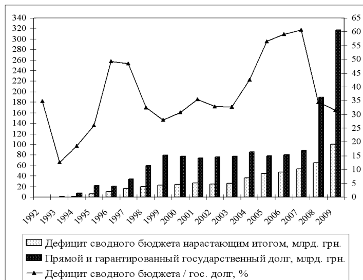
Рис. 1. Дефицит сводного бюджета нарастающим итогом и государственный долг в Украине в 1992-2009 гг., млрд. грн.

Источник: составлено на основе данных Государственного комитета статистики Украины и Министерства финансов Украины [5-8]