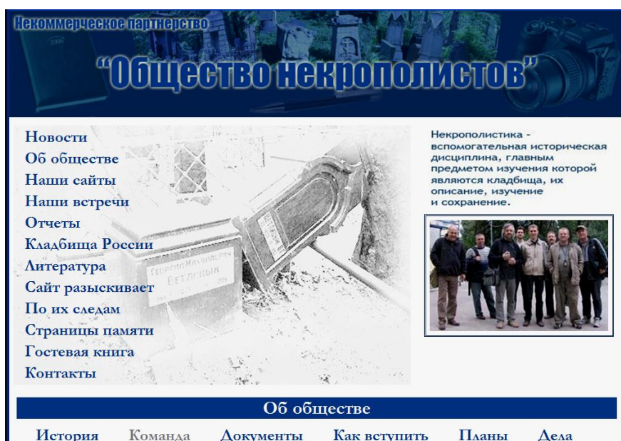
Рис. 4. Главная страница сайта