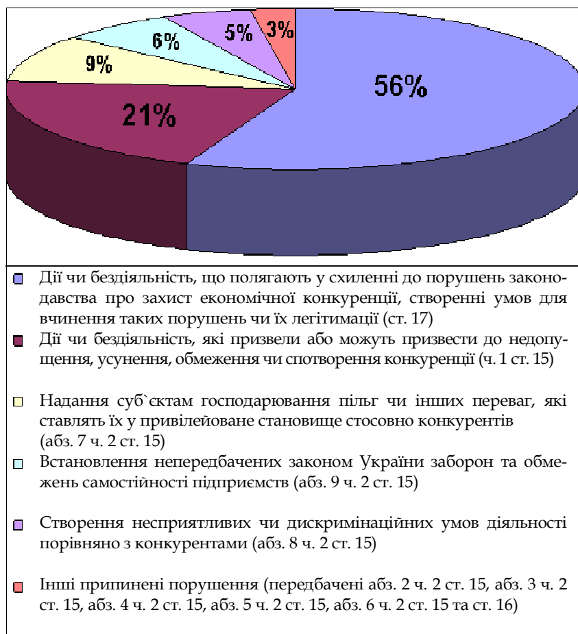
Рис. 2. Структура порушень у вигляді антиконкурентних дій органів влади, органів місцевого самоврядування, органів адміністративно-господарського управління та контролю у 2011 р., %

Отже, маємо незбалансовану макроекономічну ситуацію, яка не регулюється державними інститутами. Можна припустити, що монополісти, які отримують надприбутки, перерозподіляють їх не на техніко-технологічну модернізацію виробництв та впровадження інноваційних проектів на своїх підприємствах, а фінансують нові захоплення інших активів у економіці, диверсифікуючи їх погалузово. Це призводить до стагнації та занепаду промисловості, що позначається на зниженні обсягів технологічної продукції у структурі експорту. Натомість зростає сировинна частка, що свідчить про загальний низький рівень технологізації економіки України, веде до занепаду промислового виробництва у структурі ВВП, відповідно до якого оцінюється загальноєкономічний потенціал держави.