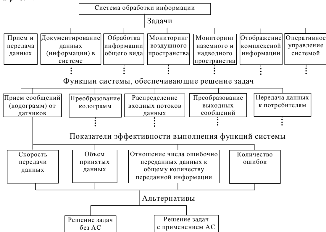
Рис. 2. Пример дерева оценки эффективности системы обработки информации реального времени

В качестве частных показателей оценки эффективности первой функции используются: скорость передачи данных, объем принятых данных, отношение числа ошибочно переданных данных к общему количеству переданной информации, количество ошибок [5]. Тогда дерево оценки эффективности системы обработки информации реального времени в данном случае будет выглядеть, как показано на рис. 2.