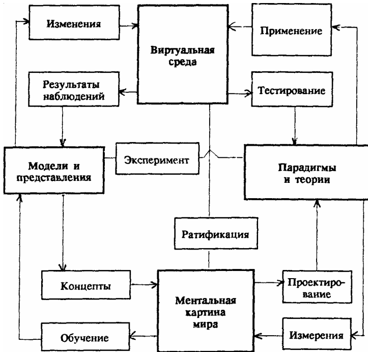
Рис. 2. Отражение в ЭВМ познания человеком реального мира

смотрения комплекса довольно сложно организованного знания, где все компоненты организации должны иметь конкретный и ограниченный доступными условиями смысл. Обратим внимание, что конкретизация даже известного знания составляет достаточно трудоемкую, требующую специального исследования проблему.