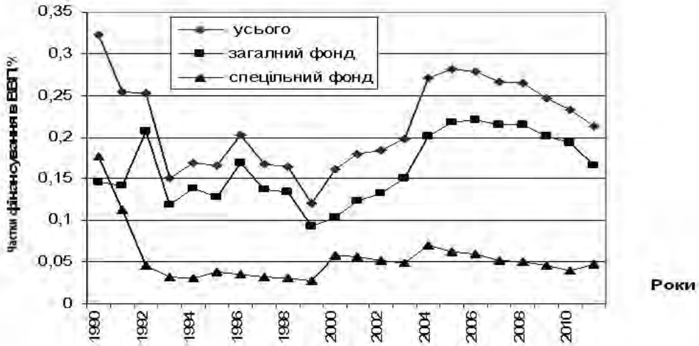
Рис. 1. Динаміка частки фінансування НАН України в ВВП України

рази. Але в наступному році цей показник різко зменшився.