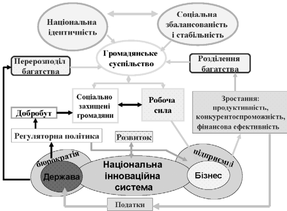
Рис. 2. Національна модель інноваційного розвитку суспільства

такий перехід, зокрема, до інвестиційно-інноваційної моделі розвитку. Ключовим заходом в цьому напрямку є розробка проекту нової Концепції національної інноваційної системи. Нової, тому що в 1999 році Верховна Рада вже схвалювала подібний державний документ — Концепцію науково-технологічного та інноваційного розвитку України [5]. На жаль, ту концепцію спонукала така ж доля, як багато інших державних документів з цього питання, які на практиці майже не виконуються або необґрунтовано скасовуються.