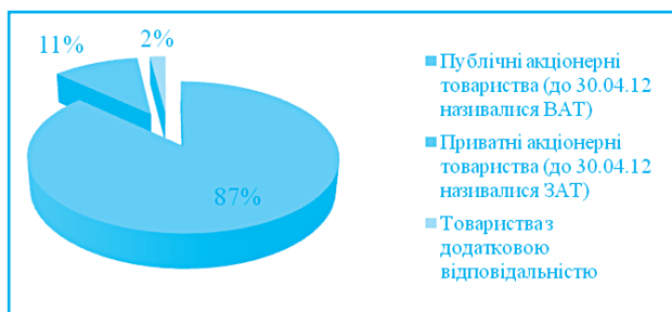
Рис. 1. Розподіл страхових компаній за формами організації в Україні