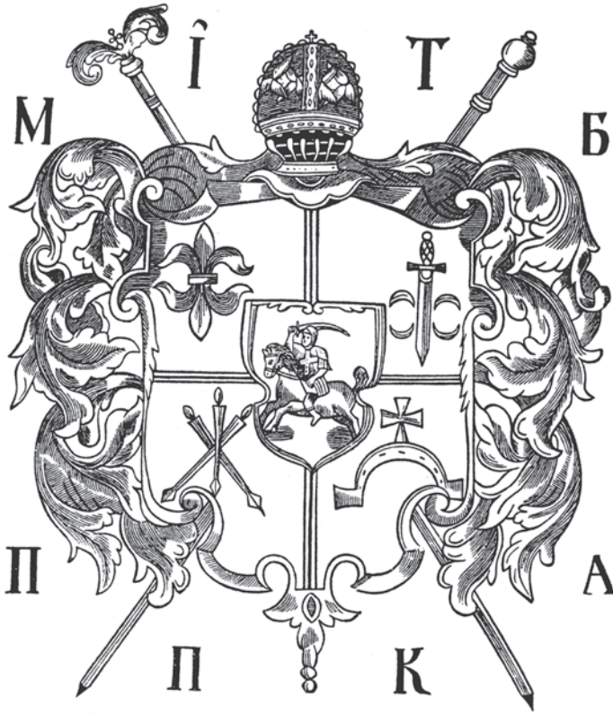
Мал.1: Герб Юсифа Тризни в “Триоди Постной” 1648 р.

доводилося шукати, як правило, в пізнішому герботворенні нащадків тих родів, що виемігрували наприкінці XV – на початку XVI ст. в інші землі Великого князівства Литовського та Руського. Так, з пізніших річпосполитських гербовників, сфрагістичних пам'яток та руських стародруків є добре відомими герби цілого ряду колишніх сіверських та смоленських родів. І серед них таких впливових, як, скажімо, Тризни, 4 Халецькі, 5 Войни, 6 Биковські, 7 Бокії 8 та ін.