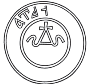
SD-35,1. Мал.18: Печатка Давида Дмитровича князя Городецького від 1388 р.