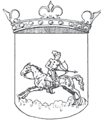
Мал.14: Герб Позняків у гербовнику Кояловича “Compendium”. Мал.15: Герб Мещеринів у гербовнику Кояловича “Compendium”.