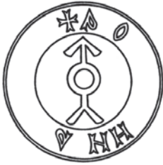
Мал.26: Печатка Панаса Кинбарова від 1496 р.

На печатках інших смоленських бояр також бачимо зображення родових знаків. Зокрема, на печатці Панаса Кинбарова 12 вміщено знак у вигляді роздвоєної здолу стріли вістрям вгору з колом всередині та частково збережений напис: + ... А ... ИН ... О ... А. 13 На печатці Мишка Войниловича Кумпича 14 знак подано у вигляді паростка з вістрям стріли вередині; вона має круглу форму розміром 20 мм та напис по колу: + МИШКОВА ПЕЧАТЬ . 46 Гришко Пиво 47 користувався печаткою круглої форми розміром 23 мм з довколовим написом: ГРИГОР ... ОВА ПЧТ та зображенням знака у вигляді літери Т над літерою W. 48