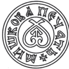
Мал.27: Мишка Войниловича Кумпича від 1499 р.