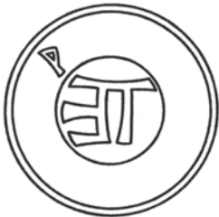
Мал.29: Печатка Гришка Олексійовича Перхур'єва від 1496 р.

Гришко Олексійович Перхур'єв 49 користувався печаткою із зображенням знака, подібного до літери П з потрійним відгалуженням праворуч та відгалуженням вгору ліворуч. 50 Василь Михайлович Мирославич 51 на печатці круглої форми розміром 24 мм вмістив знак у вигляді літери X із загнутими вбік горішніми кінцями та довколовий напис: ПЕЧАТЬ ВАСИЛ ... ЛАВА . 52 На печатці Тишка Максимовича 53 знак мав вигляд літери Т з меншою літерою И праворуч; сама печатка мала круглу форму розміром 20 мм та довколовий напис: + ПЕЧАТЬ ТИШКОВА . 54