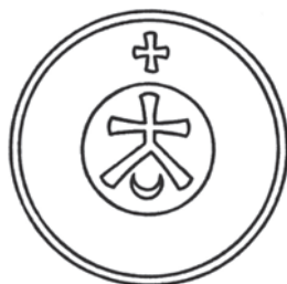
Мал.25: Печатка Суморока Григоровича Дудини від 1496 р.