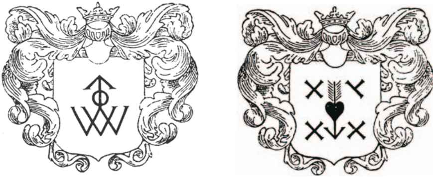
Мал.12-13: Герби Окмінських у гербовнику Кояловича "Compendium".

Вихідці зі Смоленської землі – Львовичі, поселені у Вількомирському повіті, користувалися родовим гербом, який фігурує у Кояловича під назвою Костровець: на червоному полі знак у вигляді роздвоєного здолу хреста, який перетинає півмісяць рогами догори; в нашоломнику три страусових пера; 18 Мещерини герба Погоня татарська: на блакитному полі на срібному коні вершник у зеленому вбранні стріляє з напнутого лука стрілою вліво; 19 Обухови герба Котвиця: на червоному полі родовий знак у вигляді кітви; в нашоломнику три страусових пера; 20 Позняки, осілі в Київській землі, герба Стрілець: на блакитному полі рицар, якого пронизує стріла; у нашоломнику три страусових пера; 4 Цехановичі, поселені в Мстиславському повіті, герба Могила перша відмінна: на червоному полі знак у вигляді хреста над квадратом; у нашоломнику три страусових пера. 21