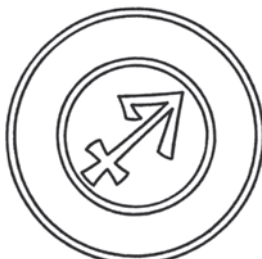
Мал.22: Печатка Федора Полтева від 1496 р.