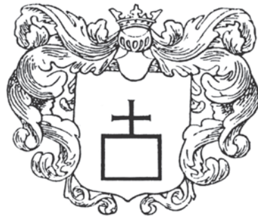
Мал.16: Герб Львовичів у гербовнику Кояловича “Compendium”. Мал.17: Герб Цехановичів у гербовнику Кояловича “Compendium”.

Разом з тим цілий ряд сіверських та смоленських родів користувався гербами явно пізнішого походження. Зокрема, обидва відгалуження роду Радогощанинів, який переселився з Сіверської землі до Новгорододоцького повіту, – Радогощанини-Униговські та Радогощанини-Ходорковські користувалися в XVII ст. польським гербом Остоя; 23 Березовські, що переселилися зі Смоленської землі до Берестейської, використовували як родовий герб Яструбець; 24 а рід Сологубів – герб Правда. 25