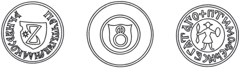
Мал.32: Печатка Гаврила Косевича від 1499 р.

– рицаря, який у правиці тримає спис, а в лівиці – щит. Печатка мала круглу форму розміром 22 мм і довоковий напис: + П ТИМОФЕЯ С БГАТАГО . 15 Дане зображення хоч і вирізняється своїм змістом зпосеред інших родових гербів Сівера та Смоленської землі, знаходить, втім, певні аналогії в герботворенні інших руських земель Великого князівства Литовського, яке широко використовувало геральдичне зображення фігури рицаря, пішого чи кінного.