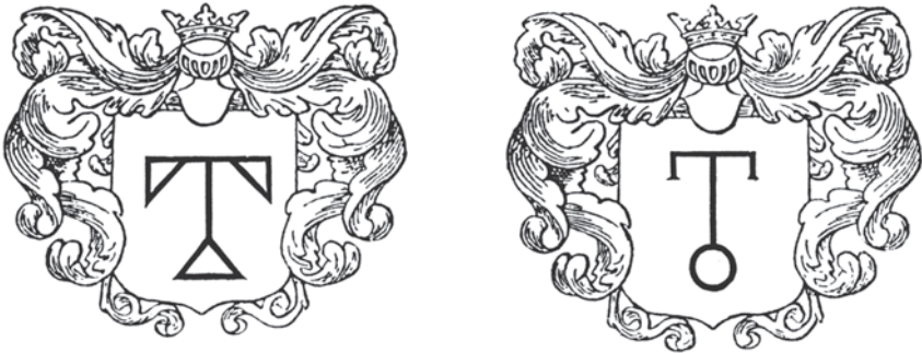
Мал.10-11: Герби Колонтаїв у гербовнику Кояловича "Compendium".