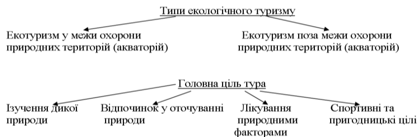
Рис. 1. Класифікація типів і цілей екотуризму.

Екотуризм традиційно пов'язаний з охороною природи, і екотури розробляються на основі унікальних об'єктів природної й культурної спадщини, або туристів, що ведуть, у місця недоторканної дикої, але не обов'язково охоронюваної природи. Екологічні тури можна класифікувати по типах і цілях (рис.1).