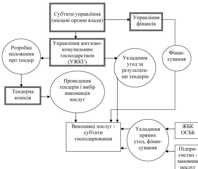
Рис. 2. Схема управління ринком надання послуг зі збору, вивезення та утилізації ТПВ

Крім того, існуюча система організації ринку послуг зі збору, вивезення та утилізації ТПВ передбачає, як уже відзначалось вище, реалізацію досить обмежених