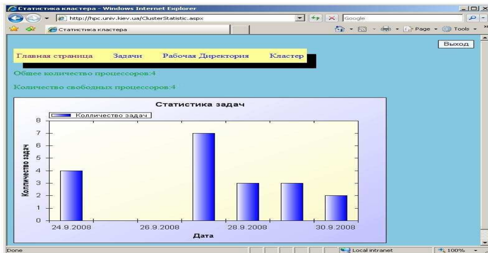
Рис. 2. Статистика встановлення задач