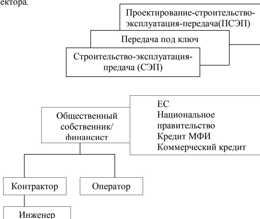
Рис.1. Контракт „Строить-эксплуатировать-передать” (СЭП)

Первым средством для ПСФЭ (рис.2) является контракт о концессии. Этот контракт дает возможность финансировать, строить и эксплуатировать генерирующий доход объектов инфраструктуры взамен за право собирать плату за услуги во время действия концессии.