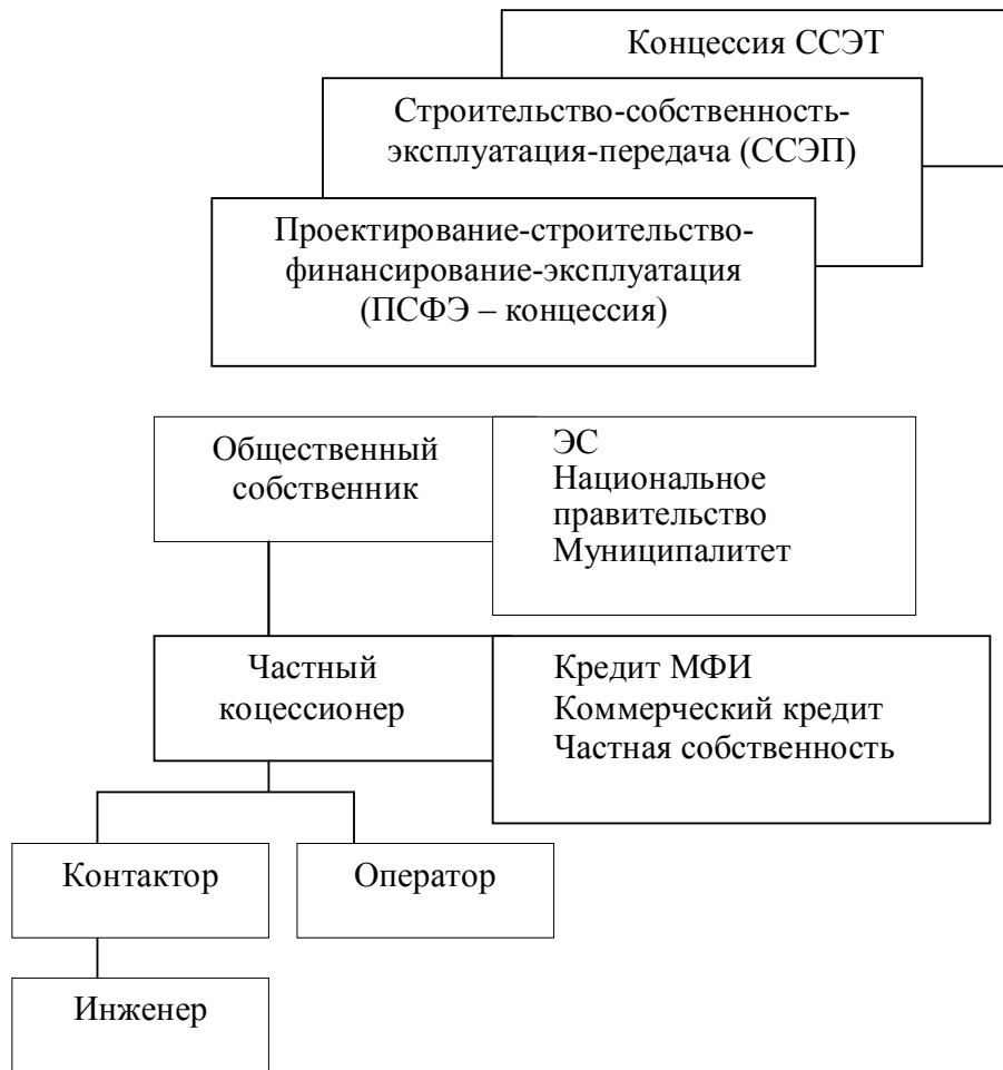
Рис.2. Контракт “Проектировать-строить-финансировать-эксплуатировать” (ПСФЭ – концессия)

Концессии могут быть даны на модернизацию, перестройку или расширение имеющегося объекта обычно сроком до 30 лет. По договору о концессии все активы – старые и новые – остаются