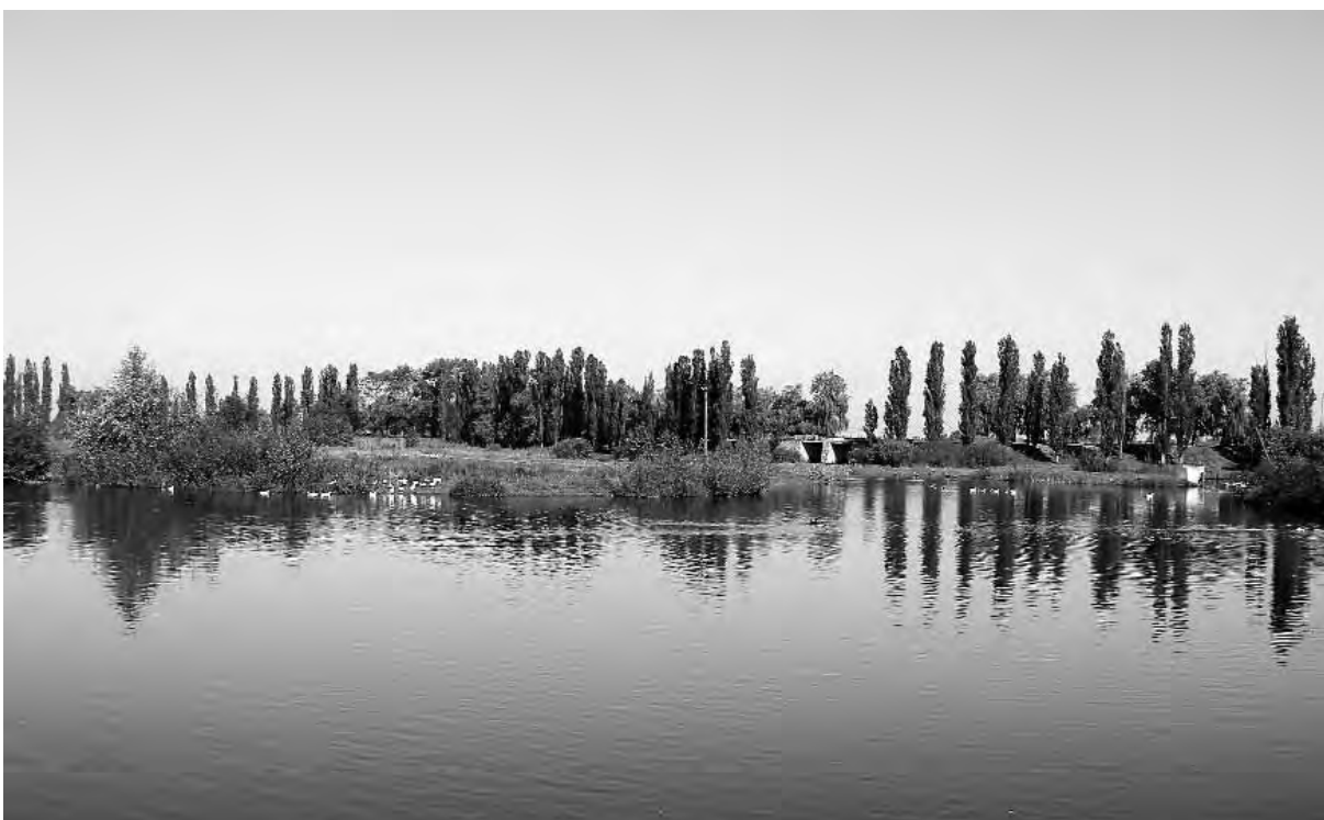
Сучасний краєвид Воронівець/Воронинців біля колишнього маєтку Кароліни Вітгенштейн