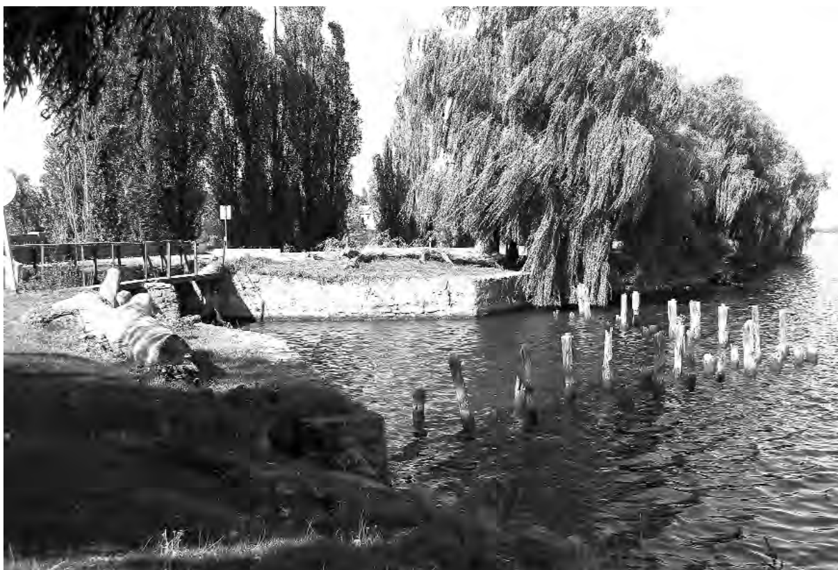
Гребля через річку Сниводу, побудована Івановськими. 2006