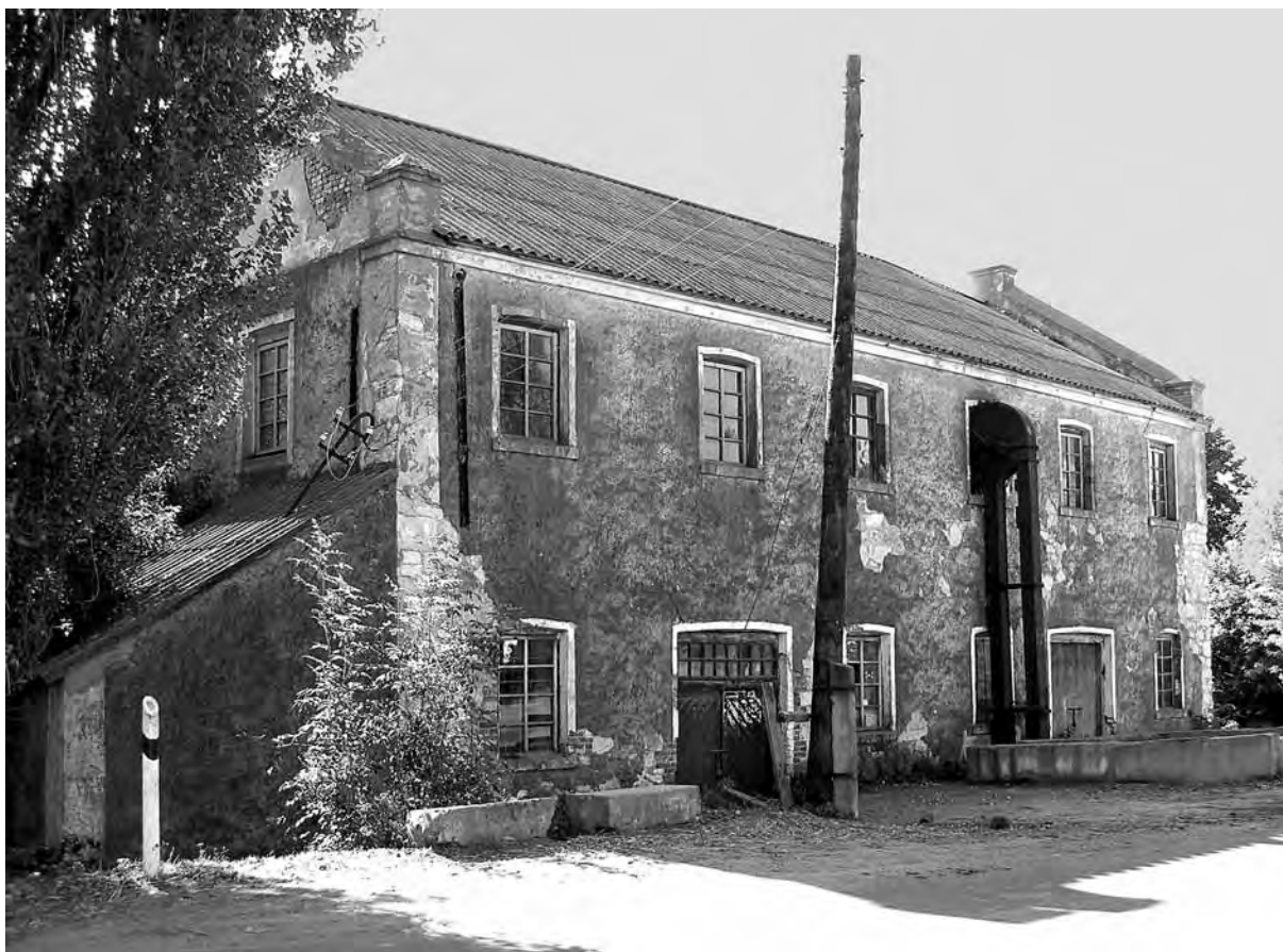
Млин, побудований Івановськими-Вітгенштейнами. 2006

Музикант протягом чотирьох місяців нікуди не виїздив з Воронинців. Він насолоджувався пристрасними почуттями, природою, творчістю. Ференц і Кароліна відчували великий духовний потяг один до одного, розуміли, що життя нарешті дарує їм щастя. За це кохання і потребу жити разом розгорнулася запекла боротьба, яка тривала кілька років. За ними рухався шлейф переслідувань і громадського осуду 13 . Попри все вони були разом. Але це вже інша історія.