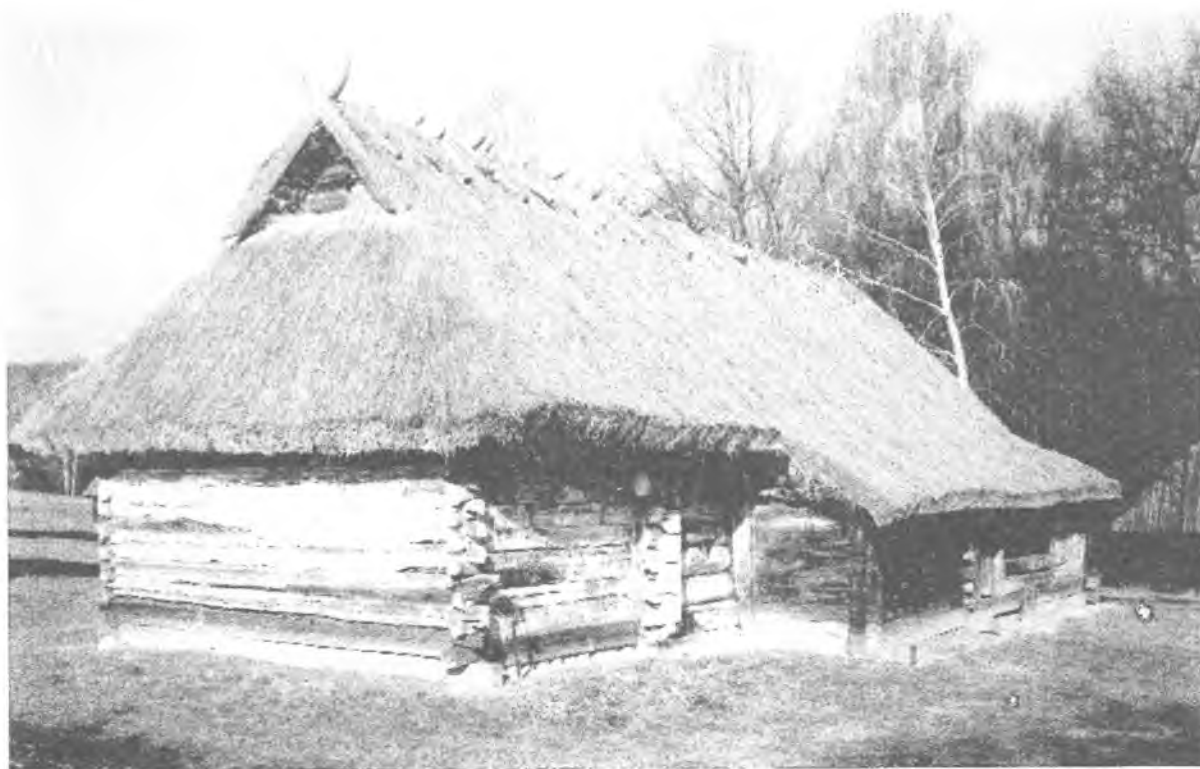
Фото 4. Хата с. Полиці Камінь-Каширського р-ну Волинської області. Музей народної архітектури та побуту України НАНУ