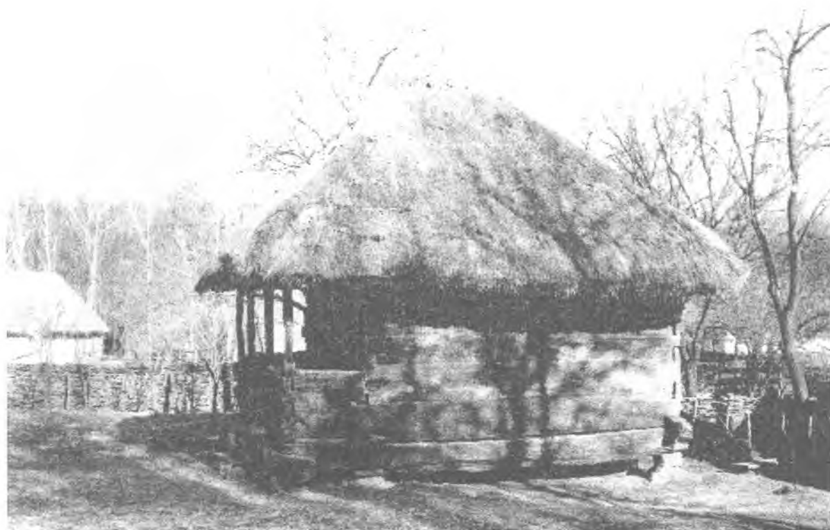
Фото 8. Комора с. Сухини Корсунь-Шевченківського р-ну Черкаської області. Музей народної архітектури та побуту України НАНУ