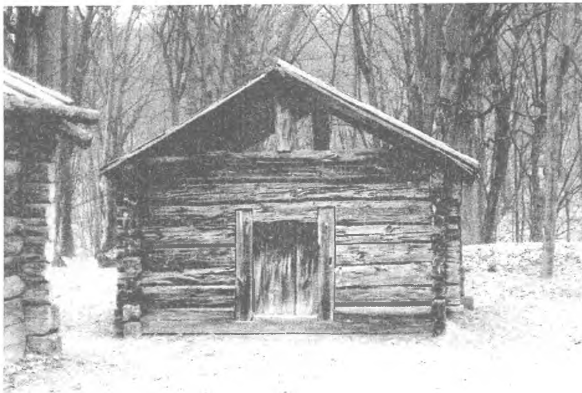
Фото 7. Стебка с. Познань Рокитнівського р-ну Рівненської області. Музей народної архітектури та побуту України НАНУ