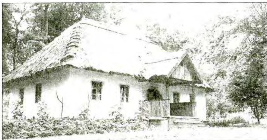
Відновлена хатина І. Ядловського на Тарасовій горі

Кожний, хто піднімається до могили Івана Олексійовича, має змогу побачити і відновлену в 1991 році його хатину. Все тут, як і колись. Зліва — Тарасова світлиця, перший народний музей Кобзаря.