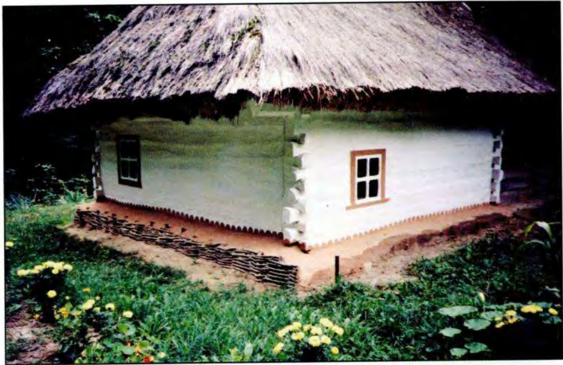
Хата кінця XIX ст. с. Дударків Бориспільського р-ну Київської обл.