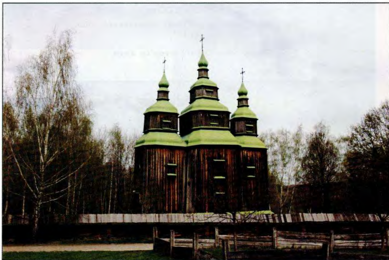
Церква 1742 р. с. Зарубинці Монастирищенського р-ну Черкаської обл.

(з експозиції Музею народної архітектури та побуту України)