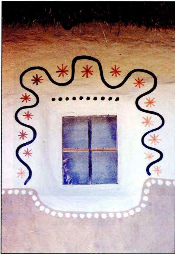
Настінне малювання та піч у хаті кінця XIX ст. із с. Солониця Лубенського р-ну Полтавської обл.