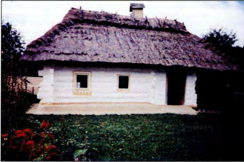
Хата середини ХІХ ст. с. Таборів Сквирського р-ну Київської обл.