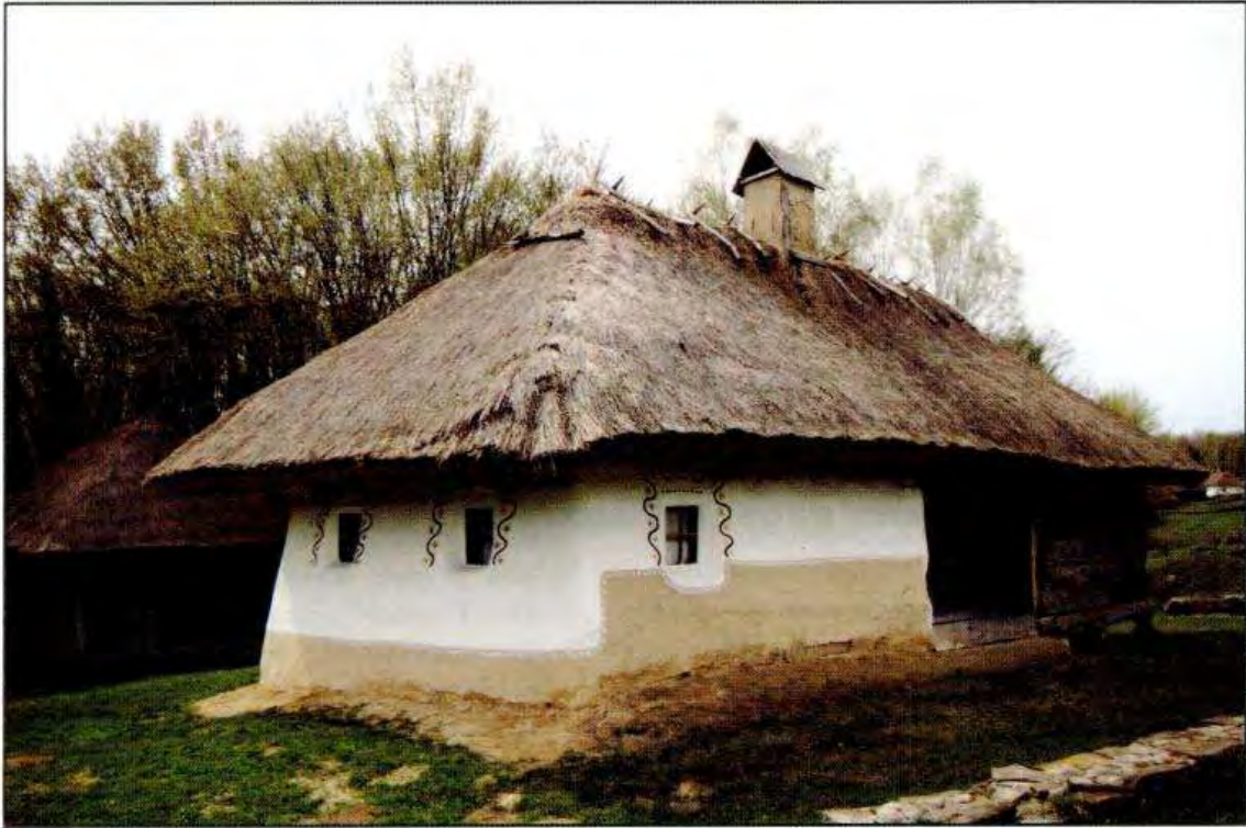
Хата кінця XIX ст. с. Солониця Лубенського р-ну Полтавської обл.