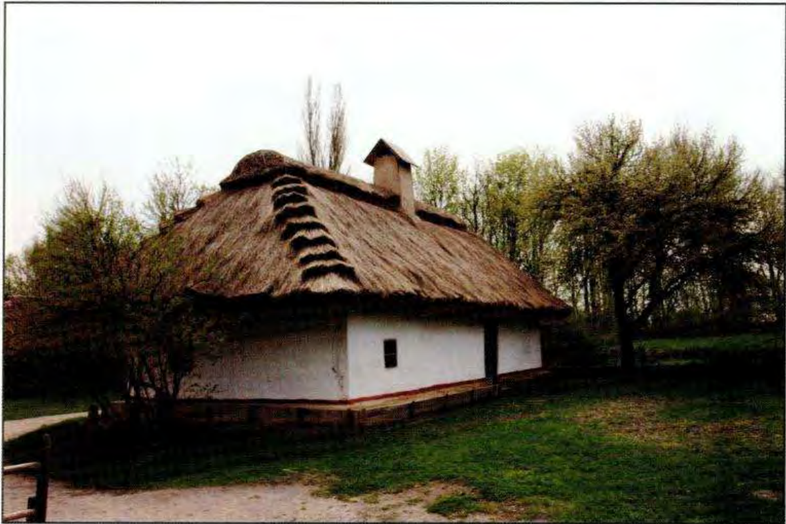
Хата XIX ст. с. Шевченкове Звенигородського р-ну Черкаської обл.