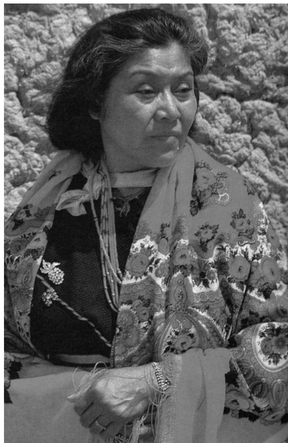
Жінки пуебло у сучасному вбранні