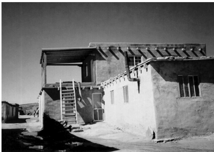
Сучасний вигляд поселення індіанців пуебло Акома. Драбина, що веде на другий поверх будинку. Фото автора (жовтень 2003 р.)

В Акома протягом року відзначалося чотири головних свята 42 . Сьогодні найбільшою популярністю серед туристів користується свято св. Штефана, яке припадає на 2 вересня. Культ святого був запозичений у місіонерів. Зранку біля церкви Сан Естебан дель Рей б'ють в барабани, скликаючи всіх до урочистої служби. Після відправи священник проводить обряд вінчання молодих. За повідомленнями, що сягають середини ХІХ ст., складовими святкування дня св. Штефана в пуебло, які належали до мовної сім'ї керес, був “танець змії”. Проте для Акома він не