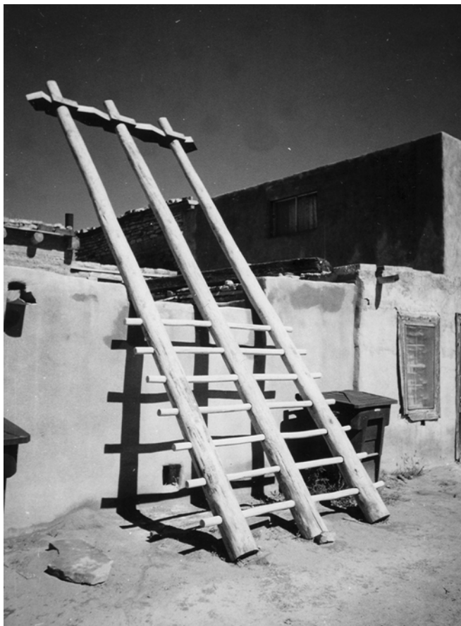
Святилище індіанців Акома — Ківа

Наступною календарною датою є Духів день. Його святкування в Акома за всіма ознаками є відгомонам католицької традиції, привнесеної на ці землі іспанцями в давні часи. День починається з того, що гурт хлопчиків ходить вулицями із дзвониками в руках, вигукуючи: “ Tsaleto, Saleto ”. Вони отримують від господарів їжу. За звичаєм, у цей день відвідують цвинтар, на могилу, до підніжжя дерев’яного хреста, викладають щось із їжі. Кульмінаційним моментом свята є, зви-