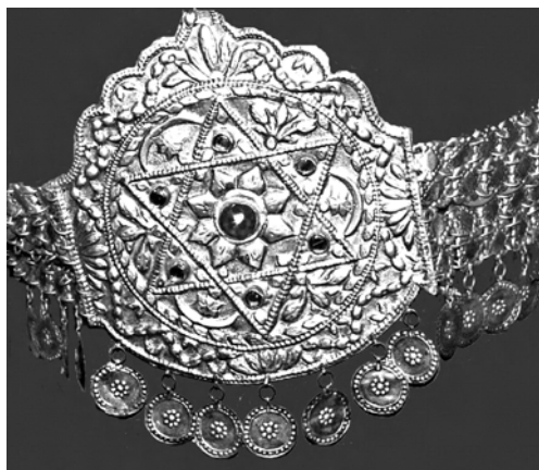
Фото 1. Налобна прикраса “Баш-алгин”. XIX ст. БДІКЗ

Production of jewellery, a kind of traditional art of the Crimean Tartar people, that developed and improved during the centuries, is under research in this article. Basing on documentary, photographic, oral materials as well as on a few existing nowadays samples, the author explores various kinds of jewellery: headdresses, temple pendants, earrings, necklaces, bracelets, rings, and brooches. The article also informs of the jewellery production periods, their development, formation, and decline, as well as of the peculiarities of the goods by Tartar craftsmen, and the techniques they used. The author raises the problem of the revival of Tartar jewellery art.