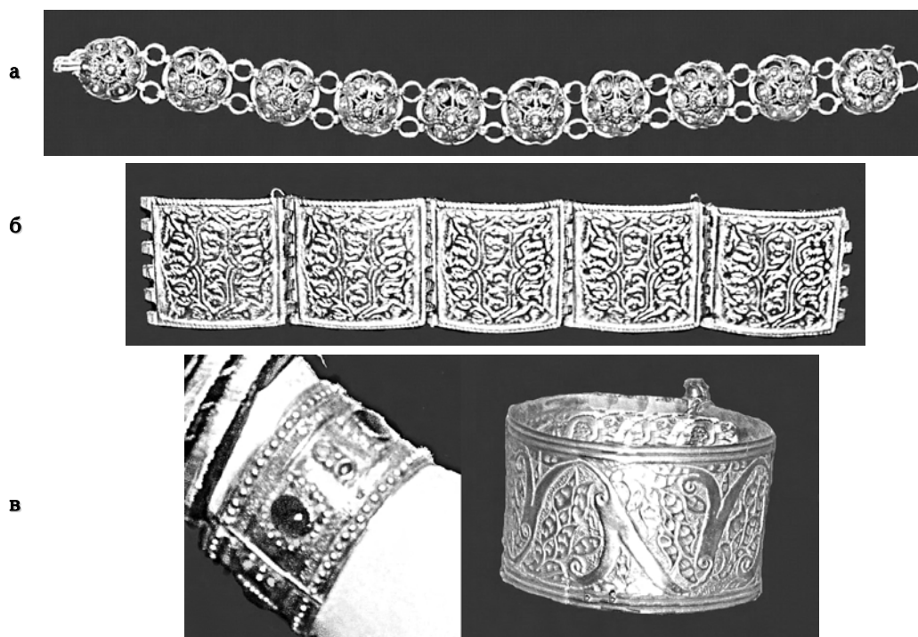
Фото 4. Браслети “білезик”, БДІКЗ: а) складені браслети. Поч. ХХ ст.; б) складені браслети. ХІХ ст.; в) суцільні пластинчасті (гнучкі) браслети. ХІХ ст.