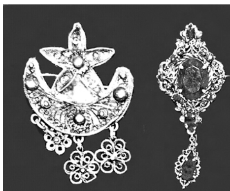
Фото 5. Брошки – “Зінет-інеси”. ХІХ ст. БДІКЗ