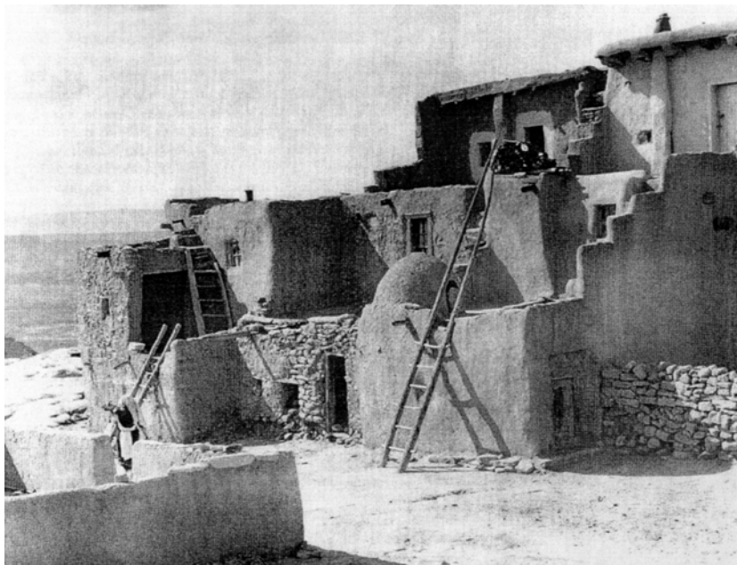
Житловий блок у південній частині Акома. Фото Ганни Форман (1930 р.). Репродукція з: Nabokov P. Architecture of Acoma Pueblo: the 1934 Historic American Survey Project. Santa Fe, New Mexico: Ancient City Press, 1986.

Посуд в Акома здавна виготовляється із місцевої сировини — глини, яка містить високий відсоток сланцю. Різноманітні гончарні вироби використовувалися в домашньому господарстві для зберігання зерна, води, висушування вовни для ткання. Після випалювання (для цього індіанці акома використовували висушений овечий послід, який закладався у видовбану в скелі нішу; її замурували разом із посудом і підпалювали — своєрідний прототип гончарної печі 17 ), вироби ставали надзвичайно міцними. Традиційно для оздоблення гончарних виробів використовували мінеральні та рослинні барвники, які наносилися пензлем, виготовленим із волокна пальми юкка. На біле тло виробу майстри Акома традиційно наносили зображення веселки, звірів і птахів — папуг, черепах (символ води та вдачі), квітів, листя дерев, геометричний орнамент (насамперед спірالی, трикутники, ла-