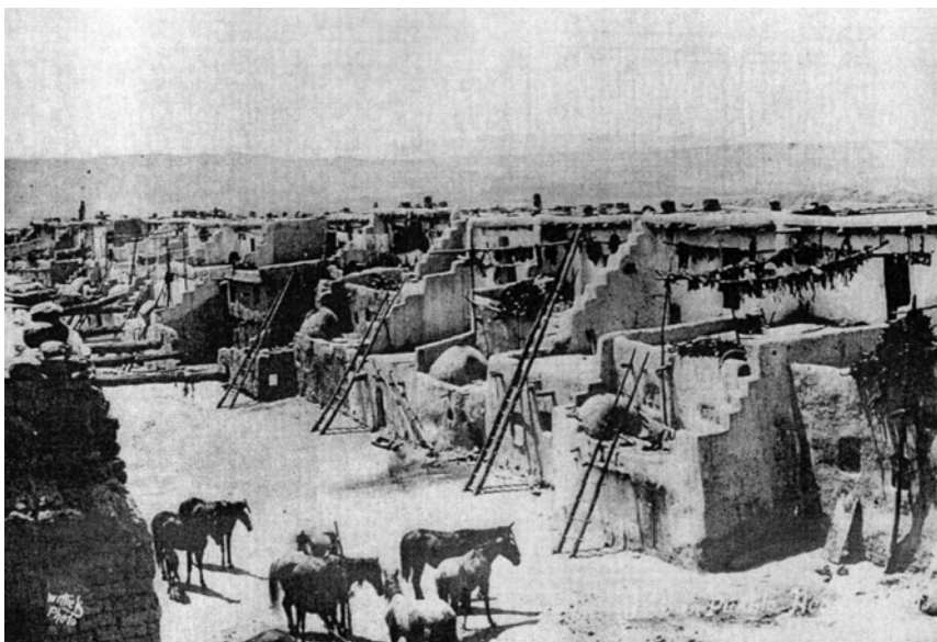
Поселення індіанців пуебло Акома (штат Нью Мексико, США). Фото Бена Віткіка (1890 р.). Репродукція з: Nabokov P. Architecture of Acoma Pueblo: the 1934 Historic American Survey Project. Santa Fe, New Mexico: Ancient City Press, 1986.

Пуебло, у свою чергу, не корилися чужинцям. В умовах нарощування присутності іспанців, вони вимушено адаптували деякі зовнішні форми католицизму, проте намагалися тримати іспанських місіонерів, по-можливості, на відстані, у той же час зберігаючи свою релігію, буквально — під землею, в кивах. Місіонери виявилися неспроможними повністю викоринити традиційні вірування та ритуали — киви й надалі залишалися центром духовного життя індіанців 10 .