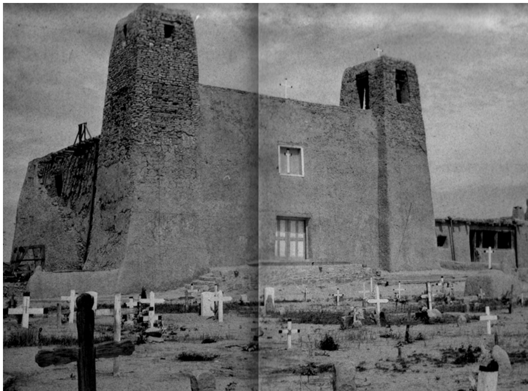
Кладовище біля підніжжя храму Сан Естебан дель Рей.

Майже три десятки років після цієї трагедії, на знак примирення з індіанцями Акома, в центрі поселення, на верхівці гори, іспанці ініціювали будівництво храму Сан Естебан дель Рей ( San Esteban del Rey ), яке тривало до 1640 року. Історія його спорудження є надзвичайною. Щоб звести стіни церкви з каменю та саману (а вони були двометрової товщини й десятиметрової висоти), а також дах, люди Акома мусили транспортувати на верхівку плато будівельний матеріал і воду. Нагадую, до селища вела крута дорога, видовбана в скелі. Особливо важко було з