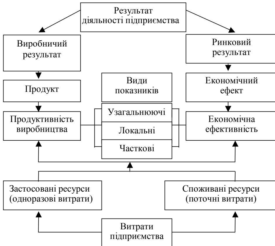
Рис.2. Методологічні засади формування показників результативності, ефективності й продуктивності

Схема на рис.1 дозволяє логічно перейти до розкриття економічного змісту і формування показників результативності, ефективності і продуктивності, що показано на рис.2 і 3.