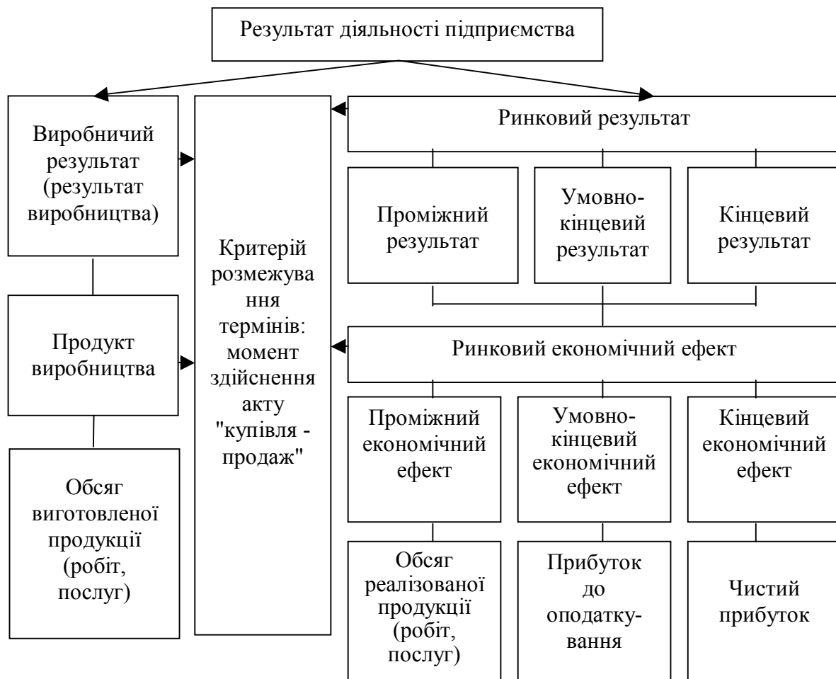
Рис.1. Загальна схема формування різних видів результату діяльності підприємства

Методологія формування цих показників залежить від економічного змісту їх чисельників і знаменників. Розглянемо спочатку по показникам, що досліджуються, методологічні засади формування їх чисельників. Це наочно показано на рис. 1.